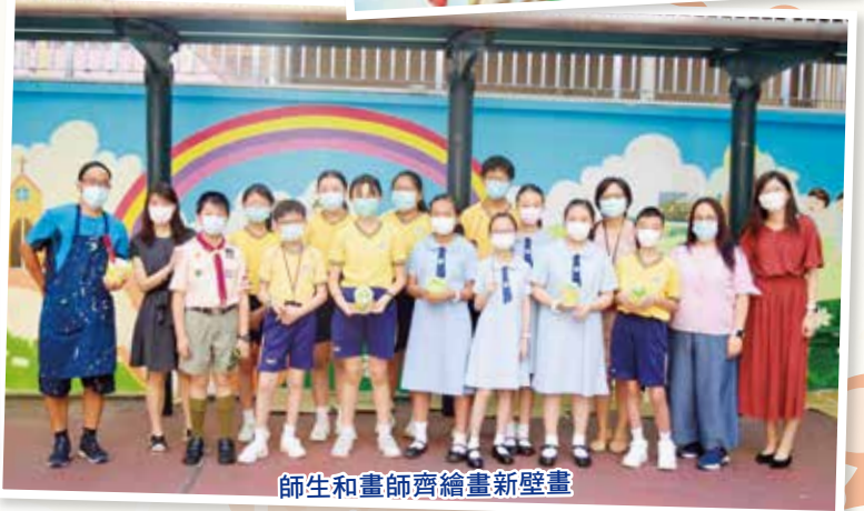
師生和畫師齊繪畫新壁畫