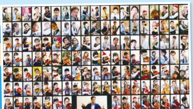
管弦樂團合奏影片