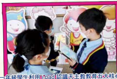
一年級學生利用i:pad認識天主教教育五大核心價