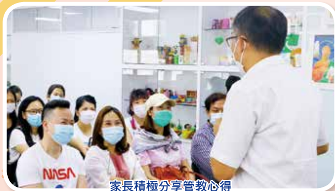
家長積極分享管教心得