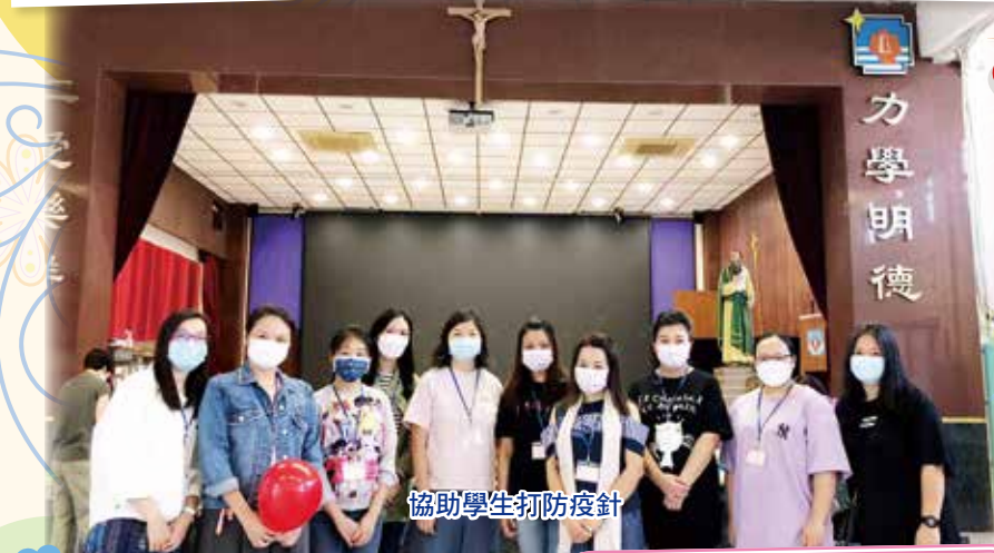
協助學生打防疫針