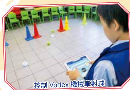
控制 Vortex 機械車射球