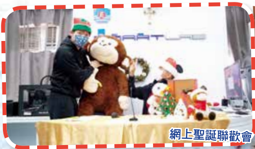
網上聖誕聯歡會，師生共享佳節