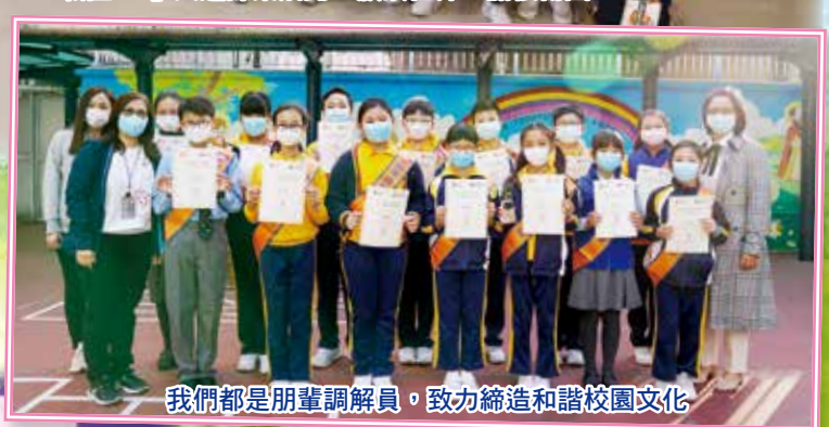
我們都是朋輩調解員，致力締造和諧校園文化