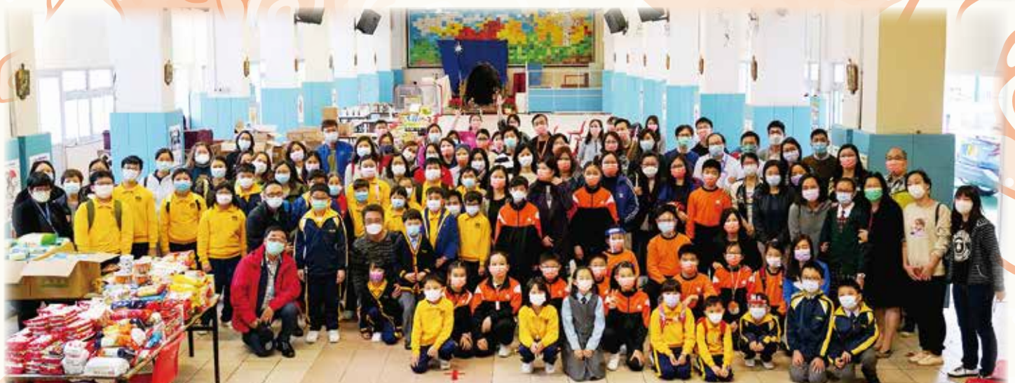
一堂三校聖誕愛心行動