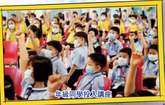
一年級同學投入講座