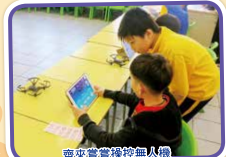
齊來嘗嘗操控無人機