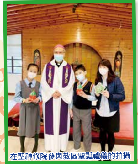
在聖神修院參與教區聖誕禮儀的拍攝