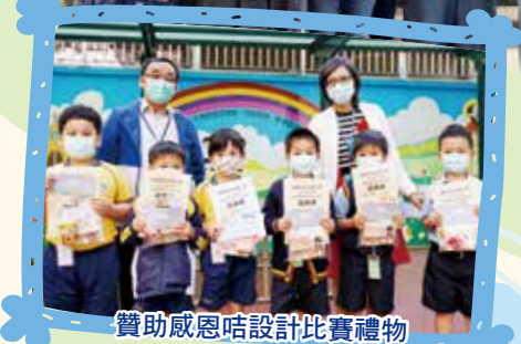
贊助感恩咭設計比賽禮物