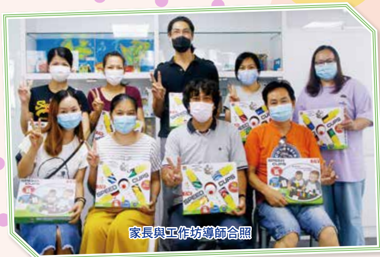
家長與工作坊導師合照