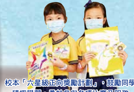
校本「六星級正向獎勵計劃」，鼓勵同學積極學習，勇於參與各項比賽及服務