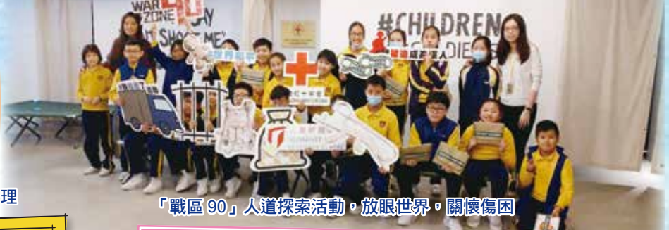
「戰區 90」人道探索活動，放眼世界，關懷傷困