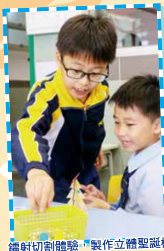
鐳射切割體驗，製作立體聖誕樹