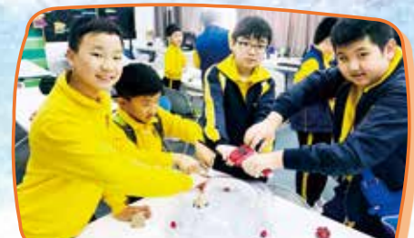
爆旋陀螺 STEM 工作坊，遊戲中學習科學原理