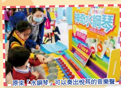
原來「水鋼琴」可以奏出悅耳的音樂聲