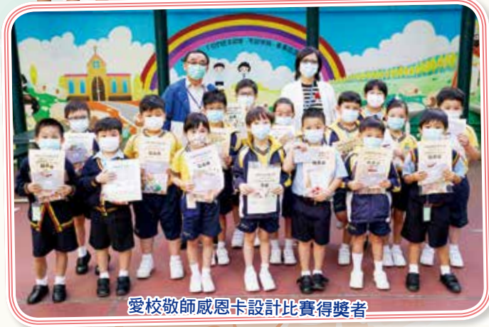
愛校敬師感恩卡設計比賽得獎者