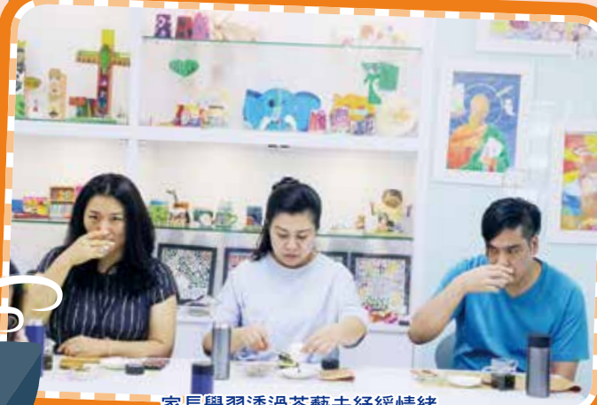
家長學習透過茶藝去舒緩情緒

疫情下，家長及學生的生活有着巨大的改變，情緒容易處於繃緊狀態。校方與家長教師會於2020年舉辦了多次家長教育課程，透過茶藝、畫畫、桌上遊戲及講座等方式，讓家長覺察自己的情緒，並嘗試以不同的方式舒緩壓力及加強親子管教技巧，從而促進親子關係。期盼在良好家校合作下，孩子及家長都能積極面對挑戰，順利過渡逆境。