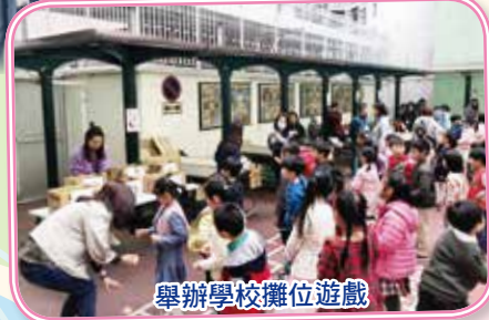
舉辦學校攤位遊戲