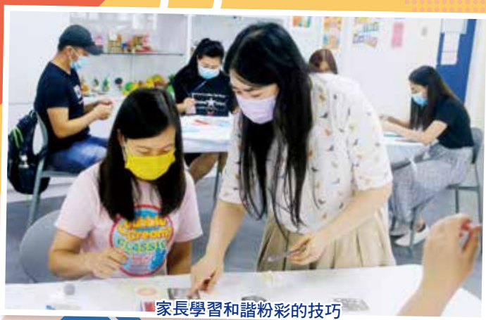
家長學習和諧粉彩的技巧

疫情下，家長及學生的生活有着巨大的改變，情緒容易處於繃緊狀態。校方與家長教師會於2020年舉辦了多次家長教育課程，透過茶藝、畫畫、桌上遊戲及講座等方式，讓家長覺察自己的情緒，並嘗試以不同的方式舒緩壓力及加強親子管教技巧，從而促進親子關係。期盼在良好家校合作下，孩子及家長都能積極面對挑戰，順利過渡逆境。