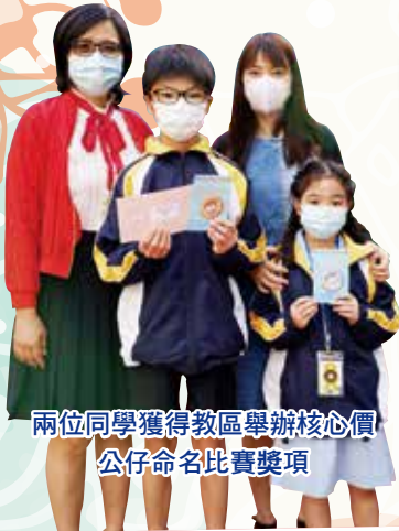
兩位同學獲得教區舉辦核心價 公仔命名比賽獎項