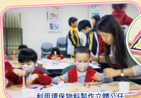
利用環保物料製作立體公仔