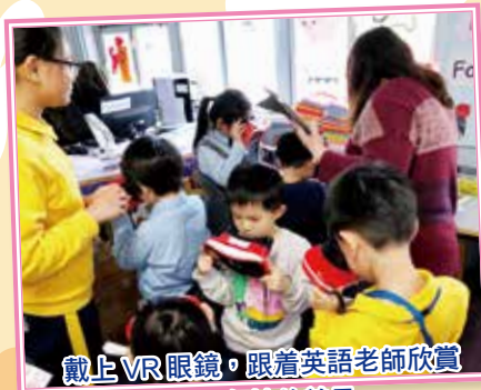
戴上 VR 眼鏡，跟着英語老師欣賞世界各地的美景