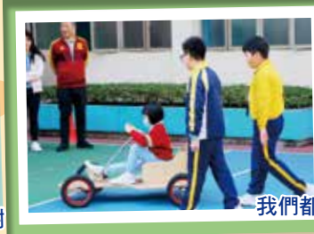
我們都是駕駛電批車的小車手