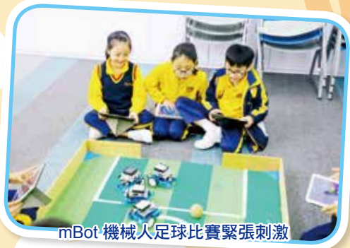
mBot 機械人足球比賽緊張刺激