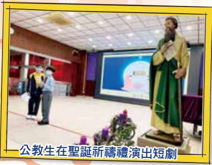
公教生在聖誕祈禱禮演出短劇