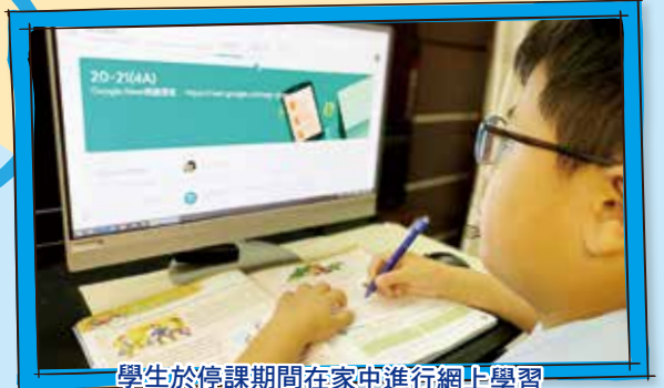
學生於停課期間在家中進行網上學習

學生利用 Google Meet 作為遠距線上學習，我們著重的不只是核心科目（如中、英、數、常）的教學，亦十分關注學生的多元智能及身心靈發展。學生除了利用 Google Meet 進行實時網上學習外，亦於 Google Classroom、MySmartABC、啟慧中國語文收取不同的學習材料、課後練習和課外讀物。教師透過 Google Classroom 收回課業及給予學生回饋。