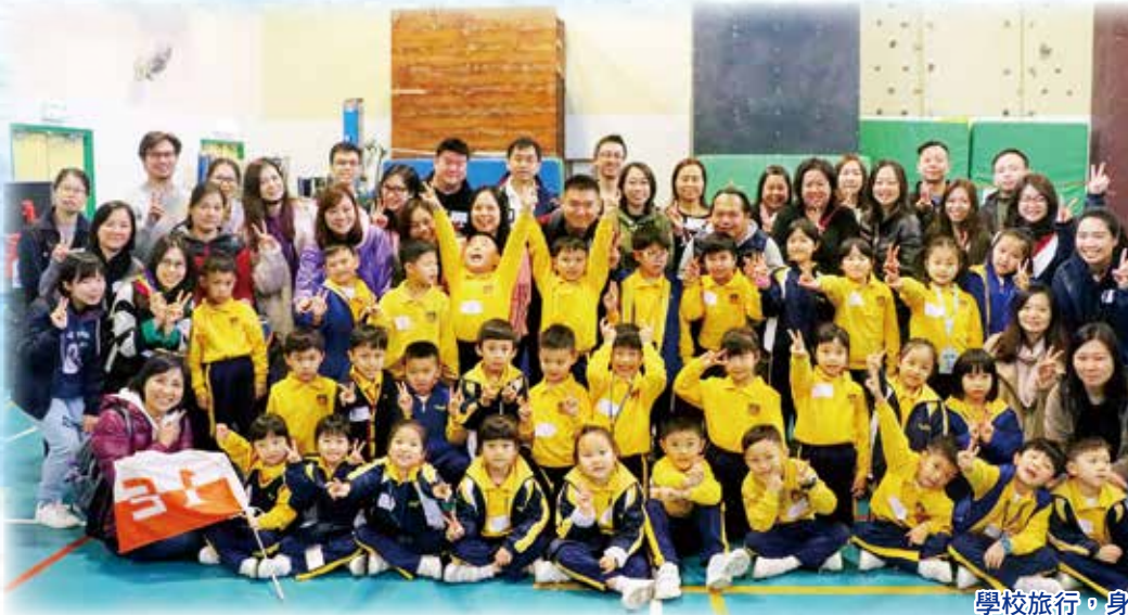
學校旅行，身心舒暢