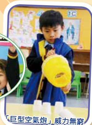
「巨型空氣炮」威力無窮