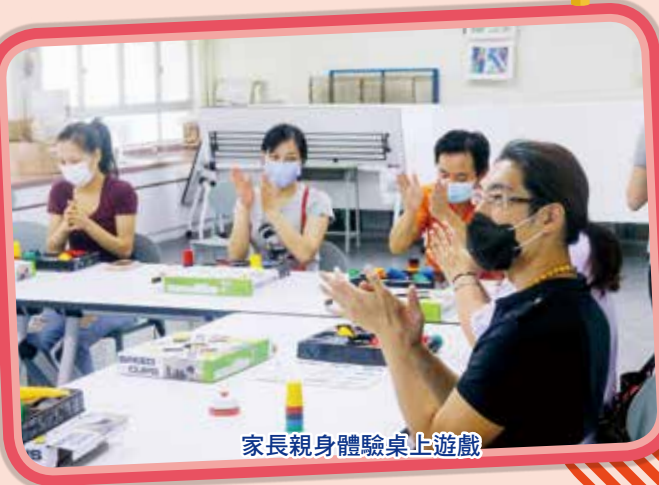
家長親身體驗桌上遊戲