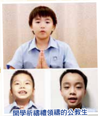
開學祈禱禮領禱的公教生