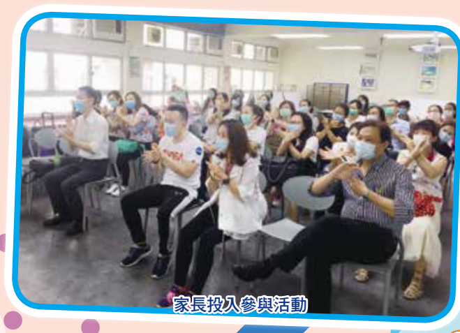
家長投入參與活動