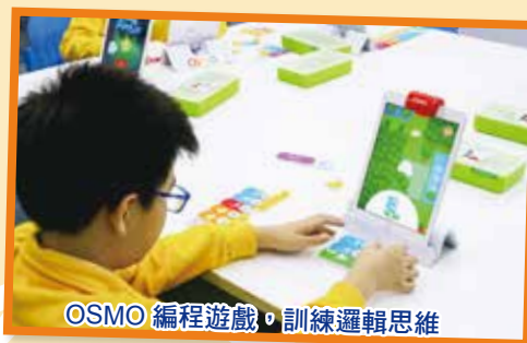
OSMO 編程遊戲，訓練邏輯思維