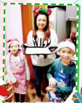
參與製作網上祈禱禮短片