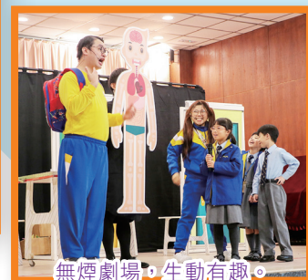
無煙劇場，生動有趣。