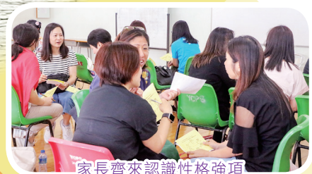
家長齊來認識性格強項