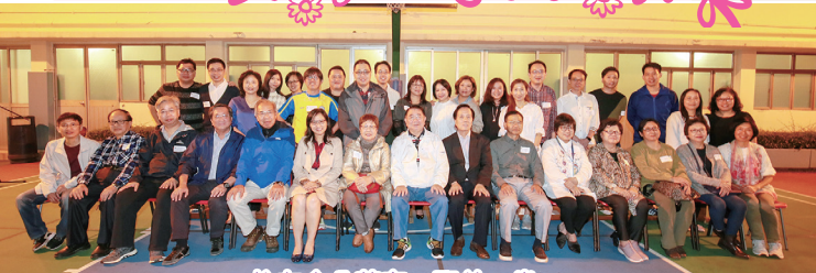
校友會盆菜宴，聚首一堂。