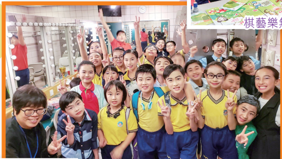
英語話劇組於學校戲劇節中盡情發揮