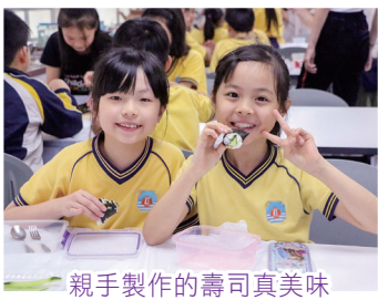
親手製作的壽司真美味