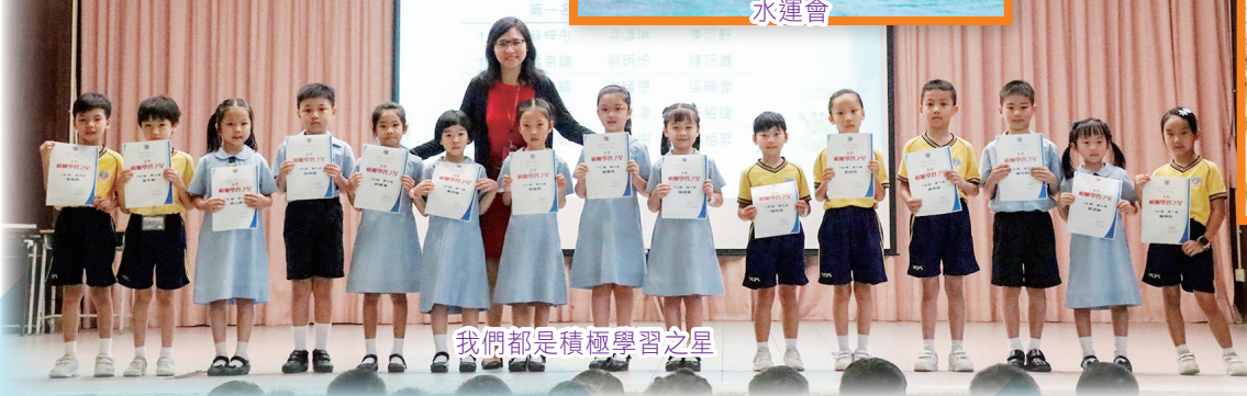
我們都是積極學習之星