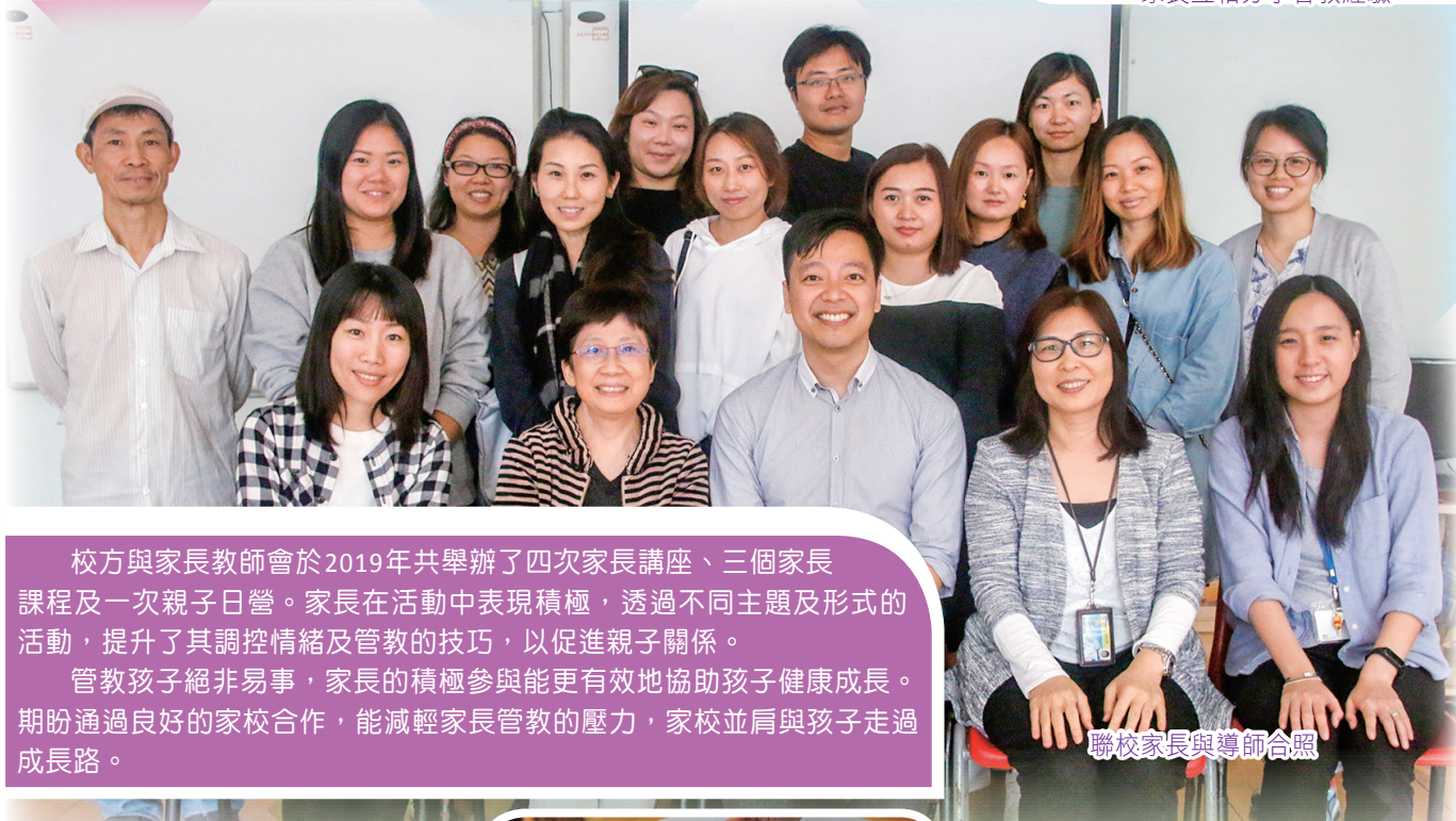
聯校家長與導師合照

校方與家長教師會於2019年共舉辦了四次家長講座、三個家長課程及一次親子日營。家長在活動中表現積極，透過不同主題及形式的活動，提升了其調控情緒及管教的技巧，以促進親子關係。管教孩子絕非易事，家長的積極參與能更有效地協助孩子健康成長。期盼通過良好的家校合作，能減輕家長管教的壓力，家校並肩與孩子走過成長路。