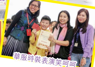
華服時裝表演笑呵呵