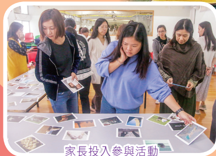
家長投入參與活動