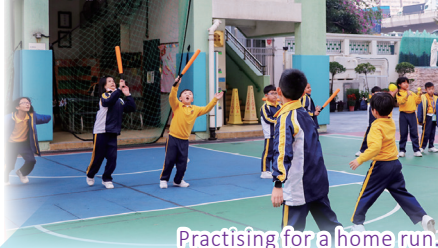
Practising for a home run.