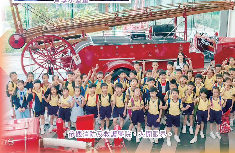
參觀消防及救護學院，大開眼界。