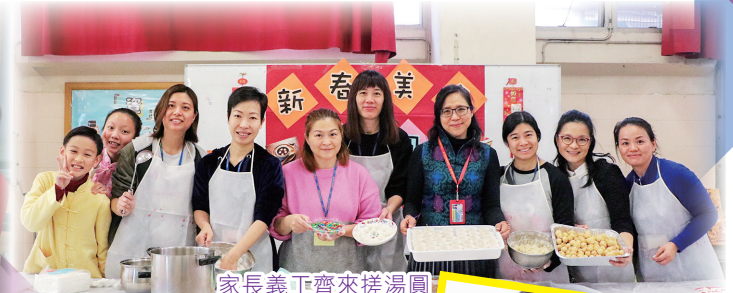
家長義工齊來搓湯圓