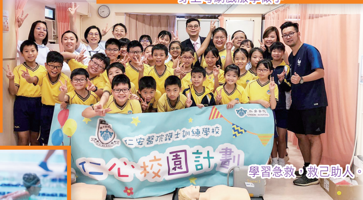
學習急救，救己助人。