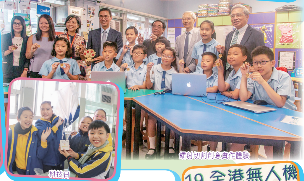
鐳射切割創意實作體驗