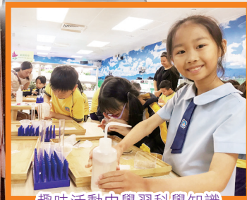
趣味活動中學習科學知識