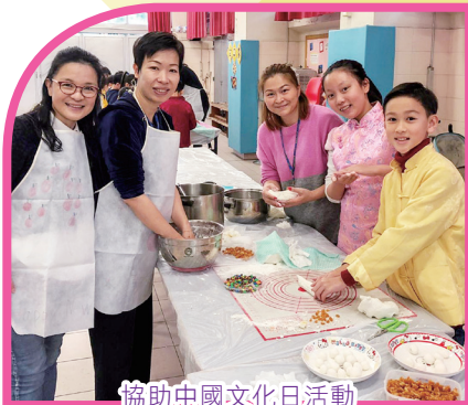
協助中國文化日活動