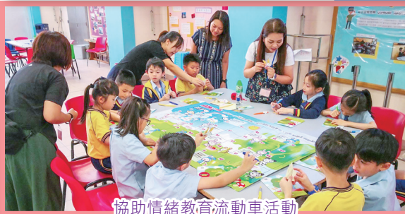
協助情緒教育流動車活動