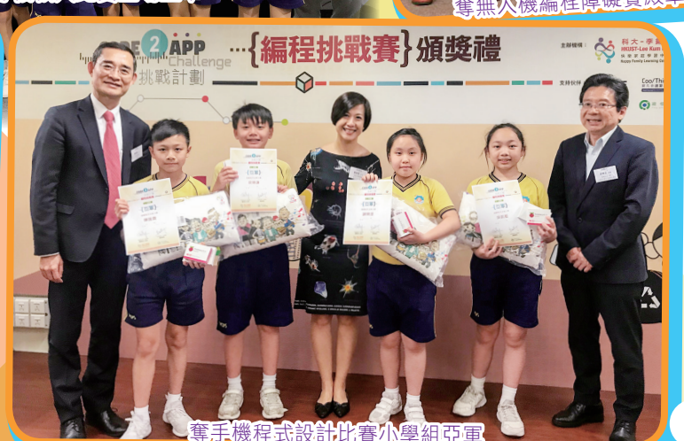
奪手機程式設計比賽小學組亞軍