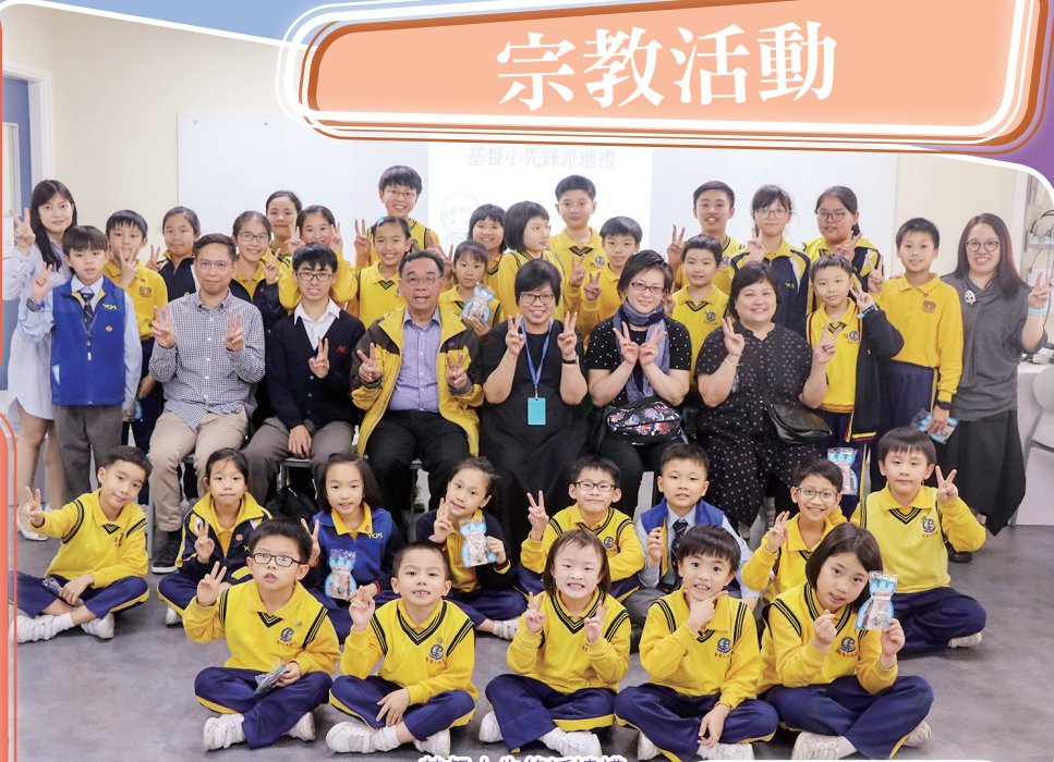
基督小先鋒派遺禮