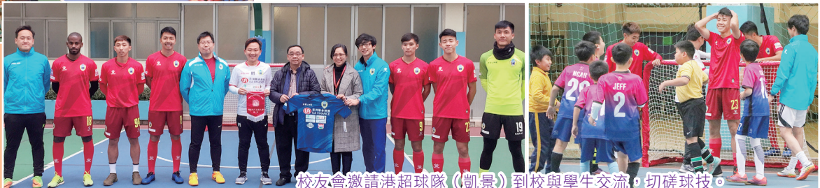
校友會邀請港超球隊（凱景）到校與學生交流，切磋球技。