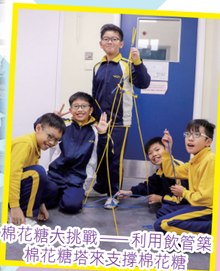
棉花糖大挑戰——利用飲管築棉花糖塔來支撐棉花糖