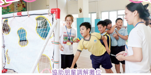
協助朋輩調解攤位