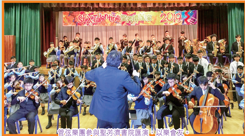
管弦樂團參與聖芳濟書院匯演，以樂會友。