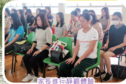
家長進行靜觀體驗