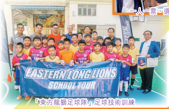
「東方龍獅足球隊」足球技術訓練