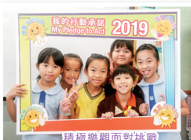
積極樂觀面對挑戰