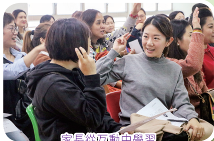
家長從互動中學習

校方與家長教師會於2019年共舉辦了四次家長講座、三個家長課程及一次親子日營。家長在活動中表現積極，透過不同主題及形式的活動，提升了其調控情緒及管教的技巧，以促進親子關係。管教孩子絕非易事，家長的積極參與能更有效地協助孩子健康成長。期盼通過良好的家校合作，能減輕家長管教的壓力，家校並肩與孩子走過成長路。