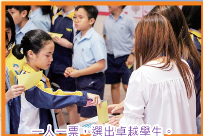
一人一票，選出卓越學生。