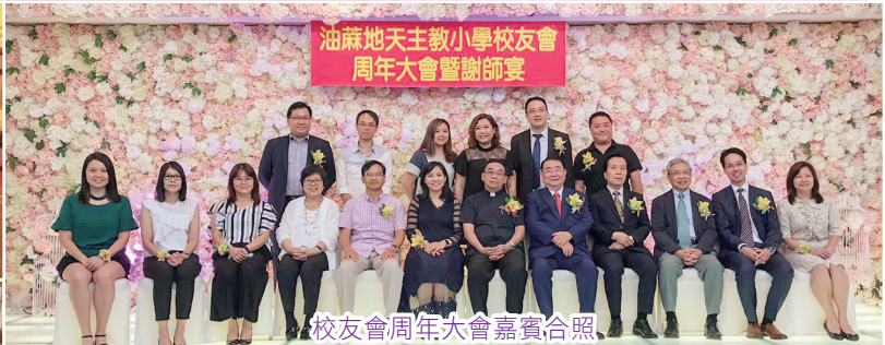
校友會周年大會嘉賓合照