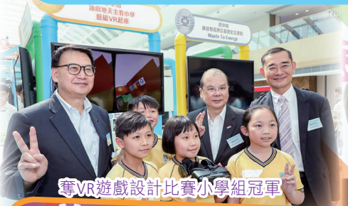
奪VR遊戲設計比賽小學組冠軍