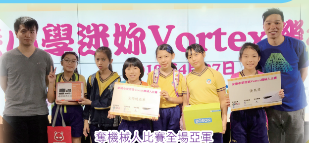
奪機械人比賽全場亞軍