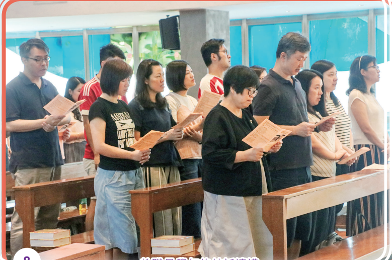
教職員學年終結祈禱禮