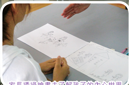
家長透過繪畫去了解孩子的內心世界