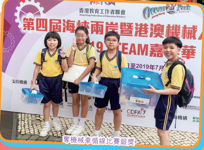
奪機械車循線比賽銀獎