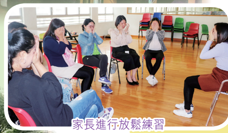
家長進行放鬆練習