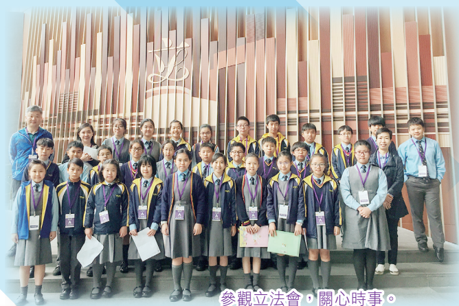
參觀立法會，關心時事。