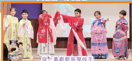
穿上粵劇戲服學做手