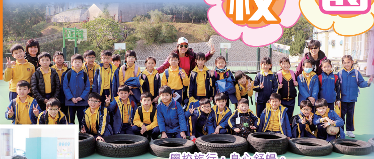
學校旅行，身心舒暢。