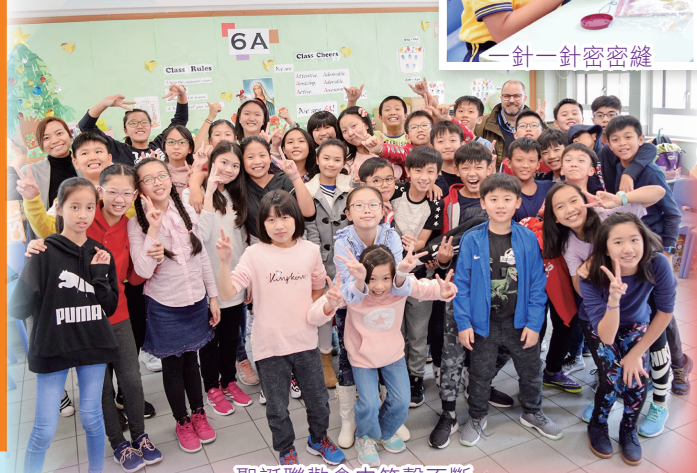
聖誕聯歡會中笑聲不斷