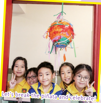
Let's break the piñata and celebrate!

The English Day was successfully held on 31st January, 2019. The theme – “Travel around the World” enabled students to participate in fun English activities while learning about different cultures from other countries simultaneously. For instance, students experienced how to make Mexican piñatas which are used in celebrations. They also wrote and hung their wishes on a Japanese torii. There were multiple opportunities for students to step out of the classroom and enjoy special activities such as booth games, VR games as well as playing baseball. Students are looking forward to the next English Day!