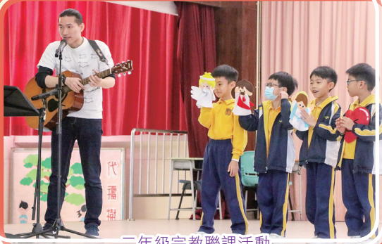
三年級宗教聯課活動