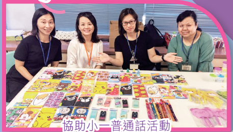
協助小一普通話活動