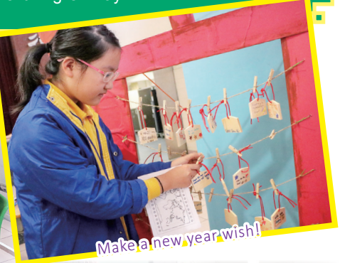
Make a new year wish!