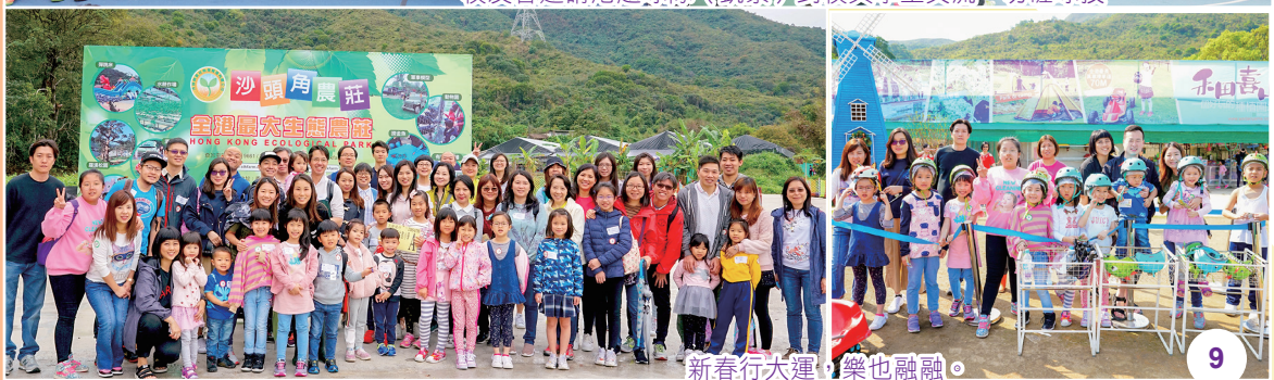
新春行大運，樂也融融。