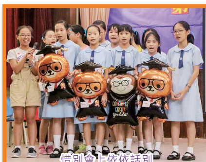
惜別會上依依話別