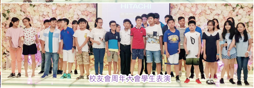
校友會周年大會學生表演