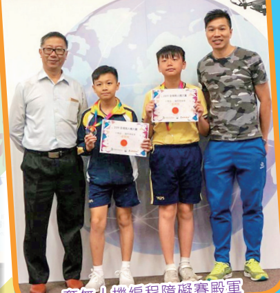
奪無人機編程障礙賽殿軍