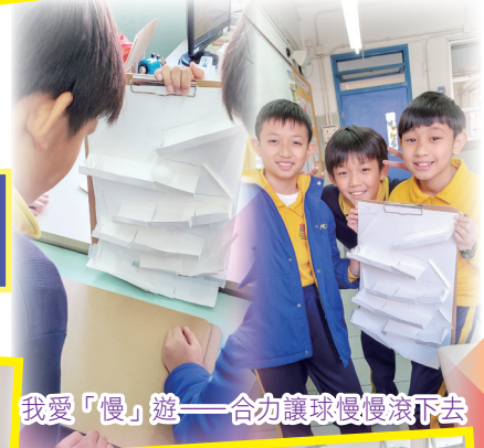
我愛「慢」遊——合力讓球慢慢滾下去

每年舉辦數學日活動，旨在配合學生的興趣和能力，設計多元化的學習活動，如：STEM活動、攤位活動及競技活動，讓學生動手操作，主動學習，給予更多運用數學解難的機會，幫助學生解決日常生活、數學或其他情境的問題。