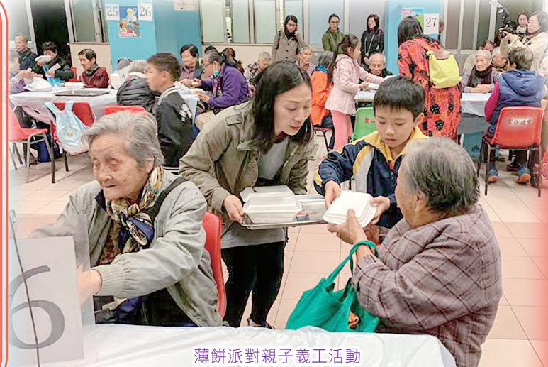
薄餅派對親子義工活動