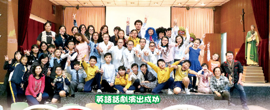
英語話劇演出成功