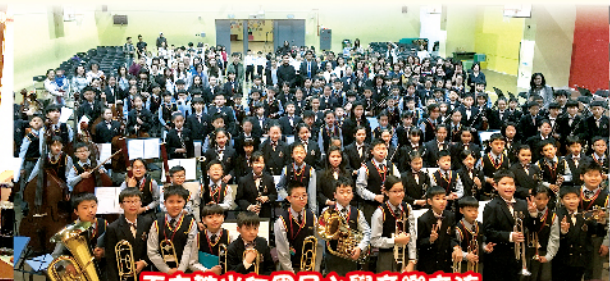
天主教光仁國民小學音樂交流

2018年12月6日，臺北古亭國民小學管弦樂團近80人到訪我校，與本校管弦樂團進行交流活動。兩地團員以樂會友，透過音樂共建友誼之橋，實屬美事。