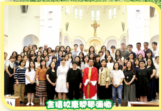
金禧校慶聯學滿堂