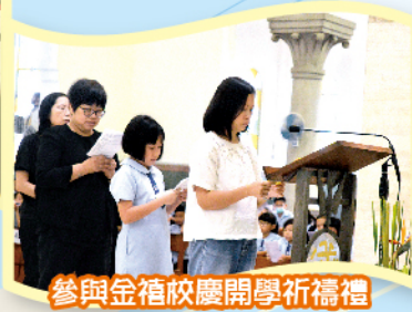
參與金禧校慶開學祈禱禮