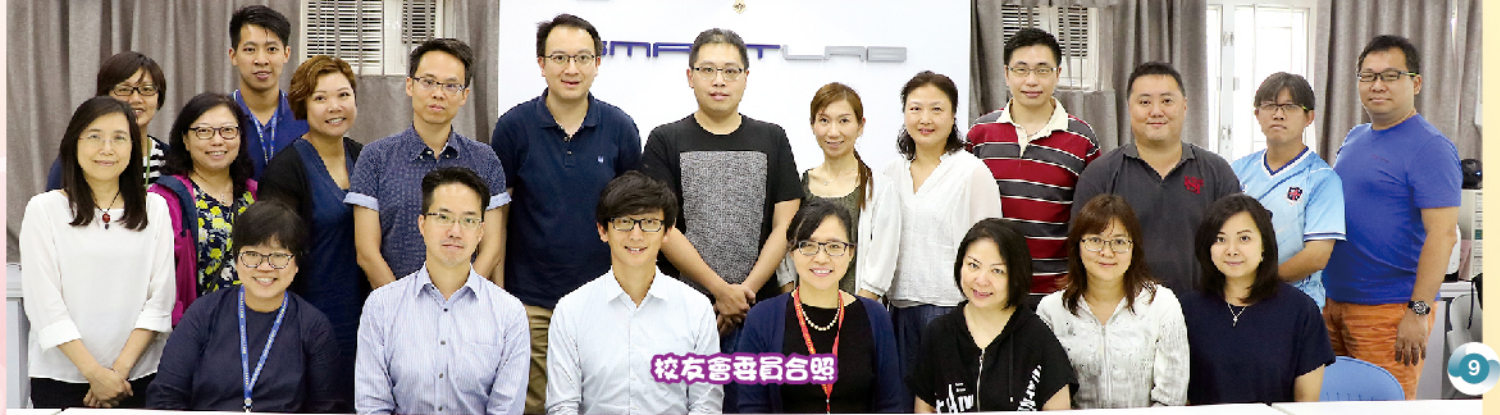
校友會委員會合照