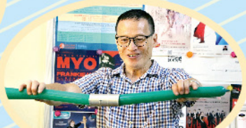
導師教授家長扭氣球的技巧