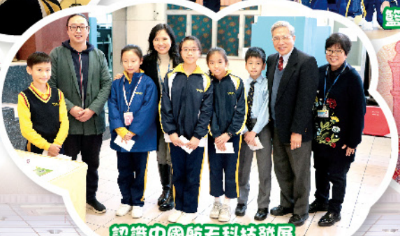
認識中國航天科技聯展