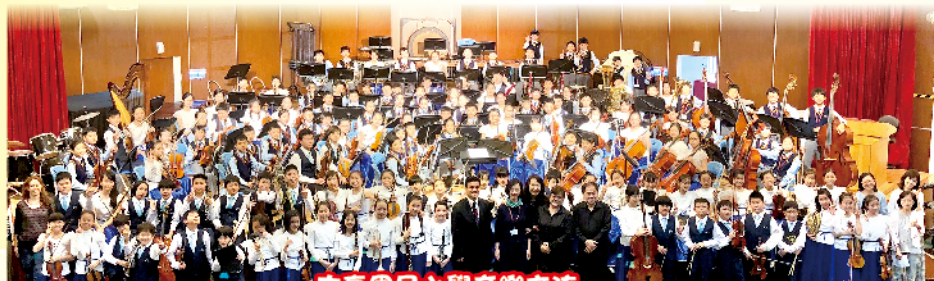
古亭國民小學音樂交流