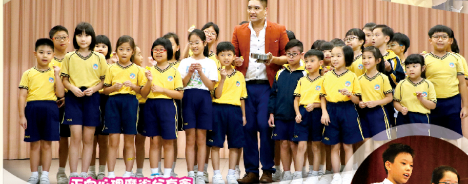
正向心理魔術分享會