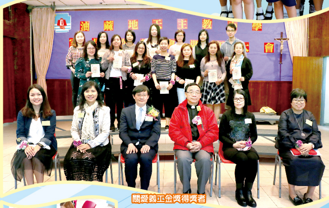
關愛義工金獎得獎者