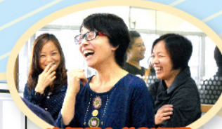
家長投入參與活動