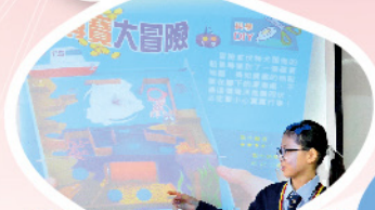
STEM主題圖書書評分享