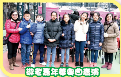
游老嘉年華樂曲班班