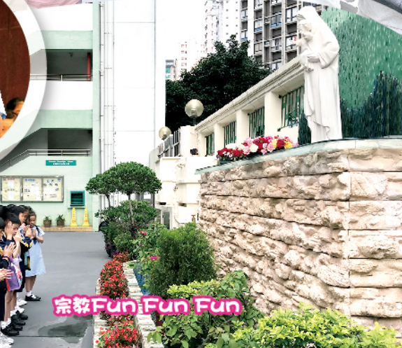
宗教Fun Fun Fun