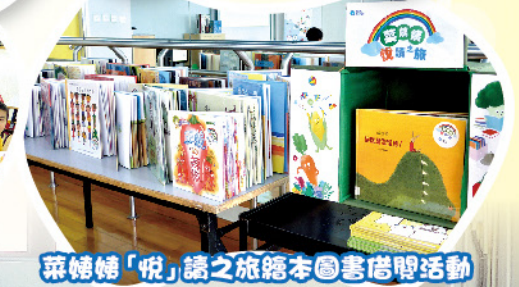
菜姨姨「悅」讀之旅繪本圖書借閱活動