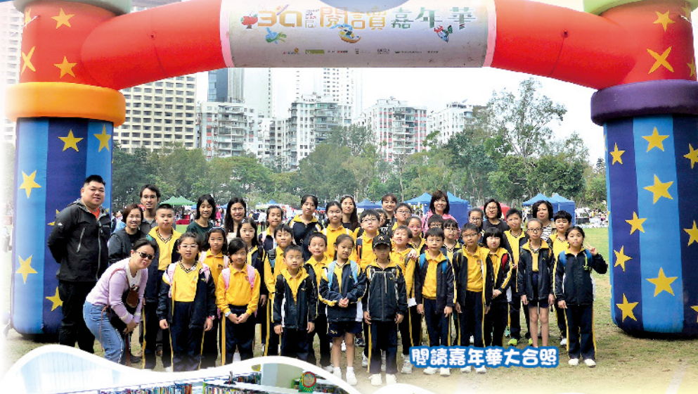
閱讀嘉年華大合照