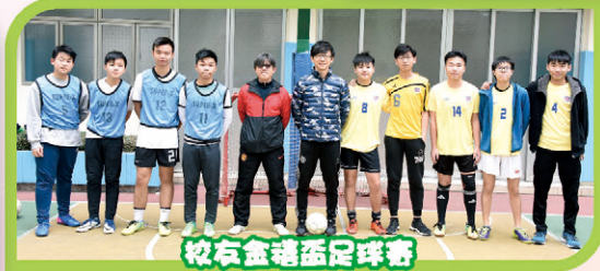
校友金禧盃足球賽