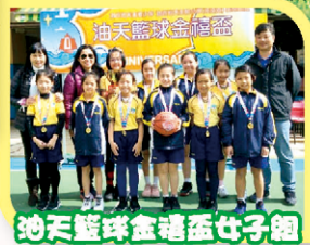
油天籃球金禧盃女子組