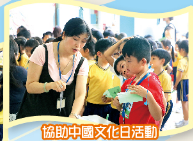
協助中國文化日活動