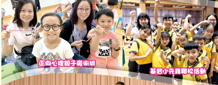
正向心理親子魔術班