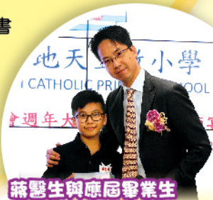
蔣醫生與應屆畢業生