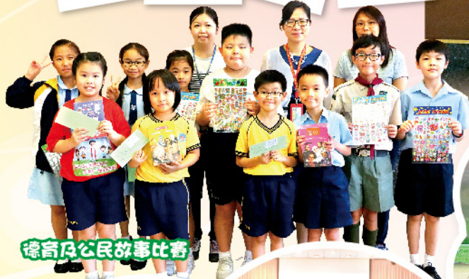
德育及公民故事比賽