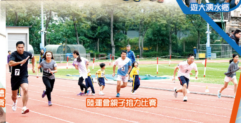
陸運會親子接力比賽