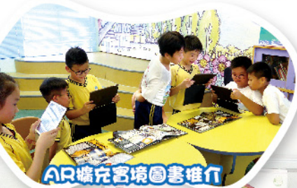
AR擴充客境圖書推介