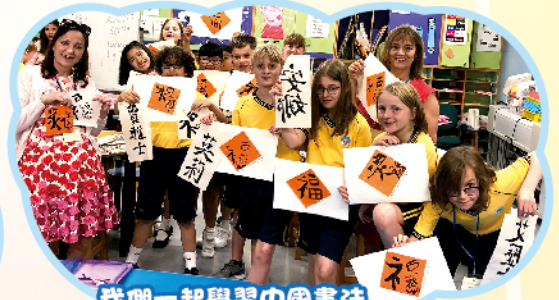
我們一起學習中國書法