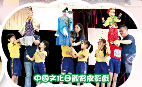
中國文化日觀賞皮影戲