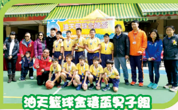
油天籃球金禧盃男子組