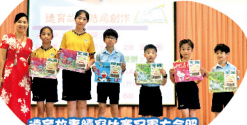
德育故事結局創作比賽冠軍大合照