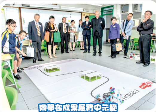
同學在成果展覽中示範