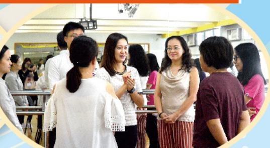
家長們從互動中學習