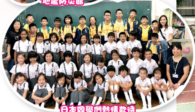
日本同學們熱情款待