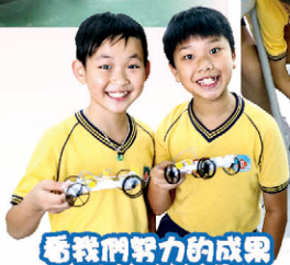
看我們努力的成果

本校以「STEM普及化」及「STEM資優化」發展STEM教育，目的是培養學生學習科學與科技的興趣，透過提升學生的創意和解難能力，培育人才。