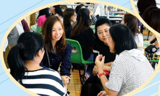
家長們分享管教孩子的困難