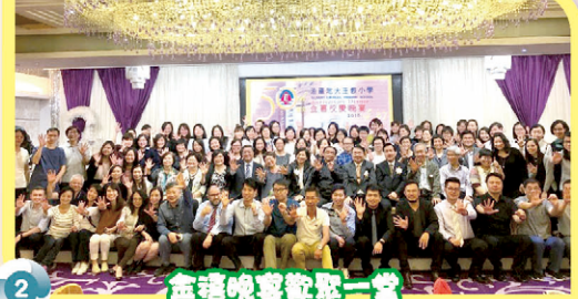
金禧晚宴歡聚一堂