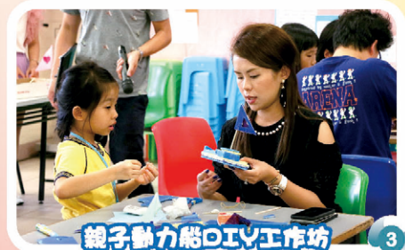
親子動力船DIY工作坊