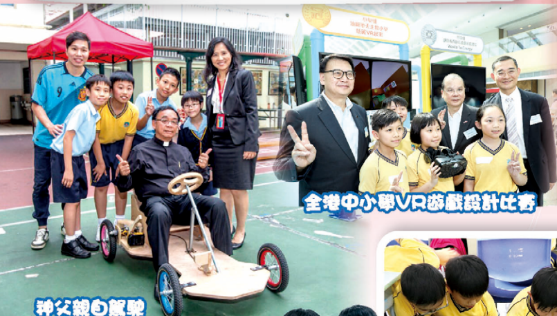
全港中小學VR遊戲設計比賽