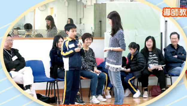
孩子向家長分享心聲