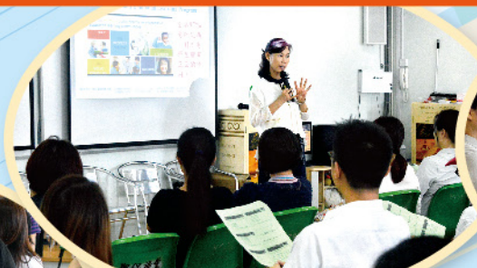
蔡女士分享育兒資訊