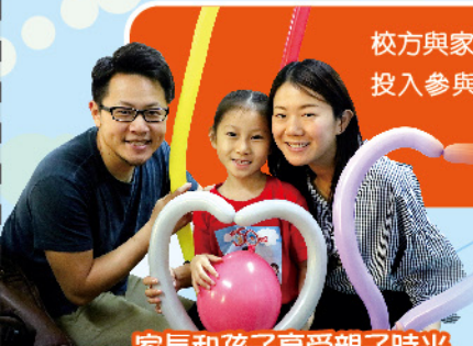
家長和孩子享受親子時光

校方與家長教師會於2018年共舉辦了六次家長講座及工作坊。本年度各項活動報名情況踴躍，家長亦非常投入參與活動。透過不同主題及形式的活動，提升了參加者的管教子技巧，亦增強了自身管理情緒的能力。管教孩子絕非易事，不僅孩子的身心靈健康重要，家長的身心靈發展亦同樣重要。本校期盼以良好的家校合作，減輕家長管教的壓力，並讓我們並肩與孩子走過成長路。