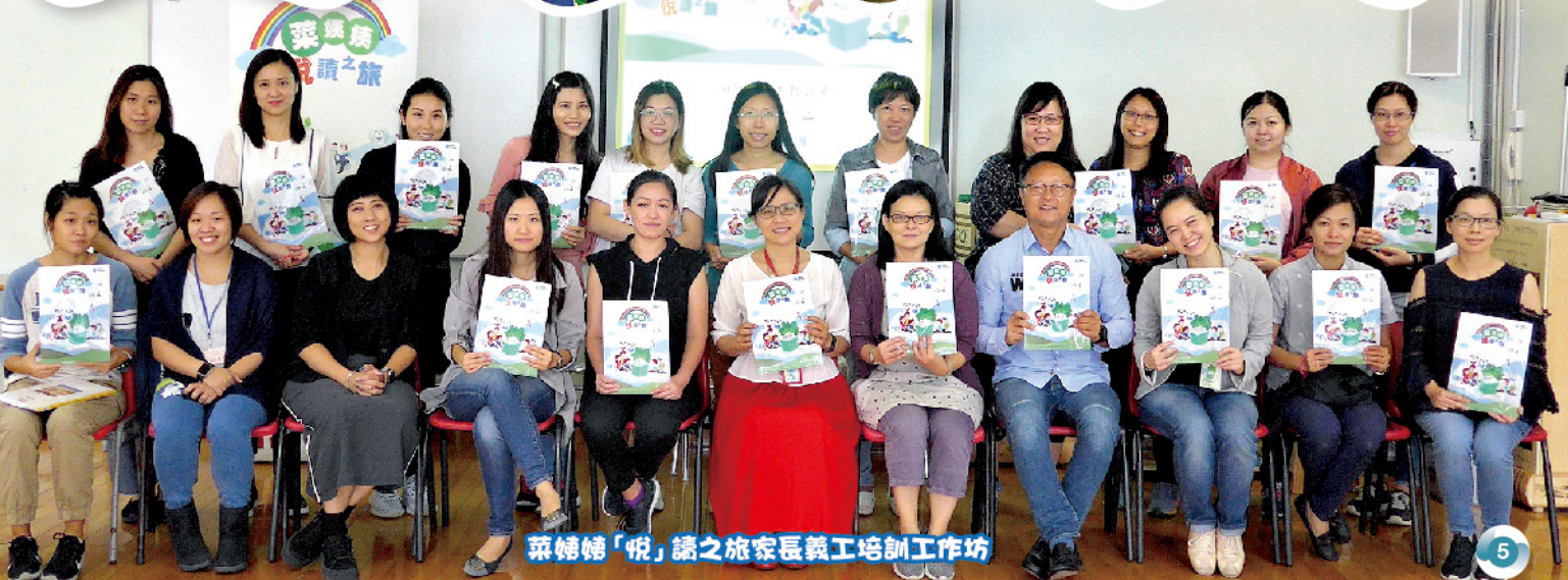
菜姨姨「悅」讀之旅家長義工培訓工作坊