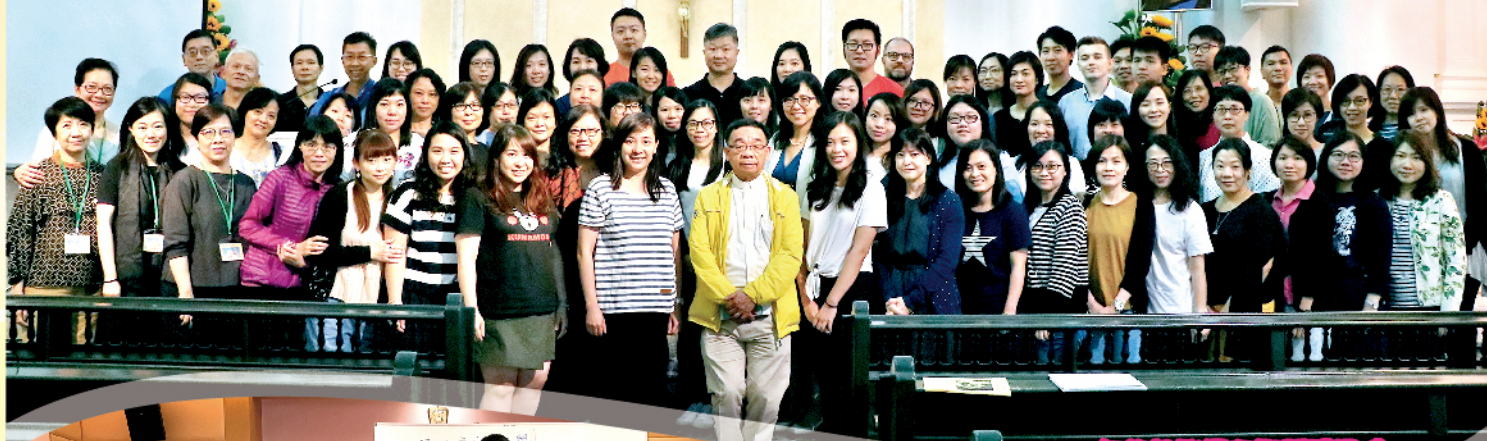
年終教職員朝聖感恩禮