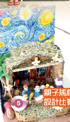
親子馬槽設計比賽