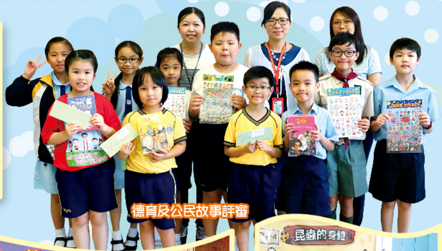
德育及公民故事評審