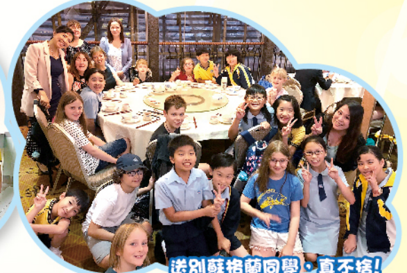
送別蘇格蘭同學，真不捨！