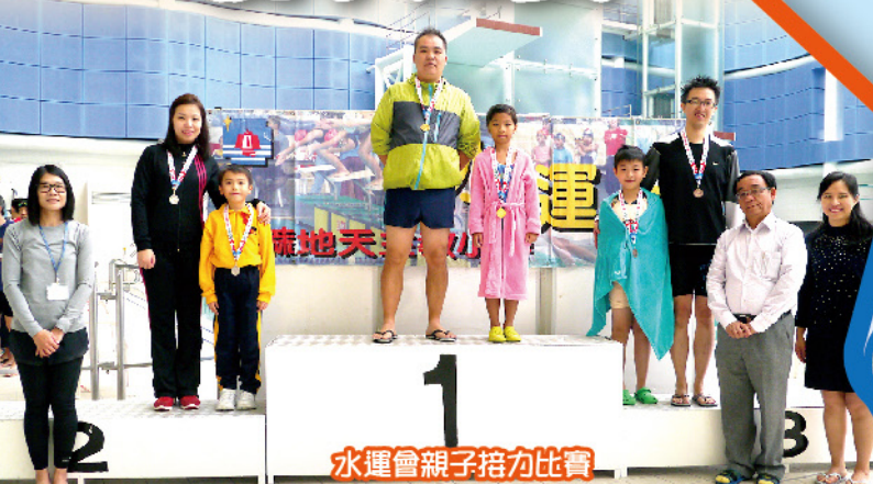
水運會親子接力比賽