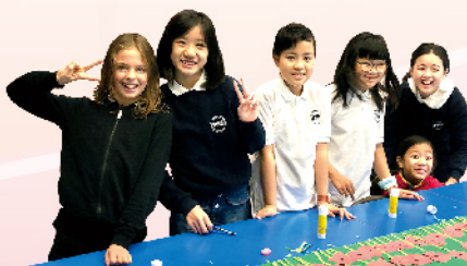
我們合力完成壁報