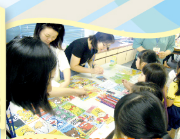
協助小一普誦話購物活動