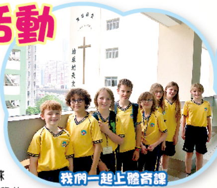
我們一起上體育課

11月4日至11日，六位五年級同學遠赴蘇格蘭愛丁堡作學術文化交流。同行還有其他中學的學生和老師。同學們到了Preston Street Primary School上課，體驗當地的學習模式。校長Mrs Allan和其他老師都十分親切友善，為大家預備的一切。他們的閱讀氣氛濃厚，著重戶外學習。他們十分喜歡中國文化，同學們還教老師們寫中國書法呢！此外，大家還參觀了不少景點，如愛丁堡城堡、國立博物館和Arthur's Seat等，對蘇格蘭有更深入的认识。交流期間，同學們入住寄宿家庭，親身體驗當地生活文化，到了不同的地方遊覽，真感激他們無微不至的照顧！期間，同學們乘火車到柏斯的青年峰會進行演說，在場有不同國籍的學生分享他們的交流經歷，場面壯觀，真是一次難忘的體驗！