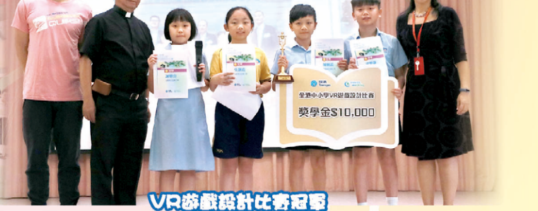
VR遊戲設計比賽冠軍