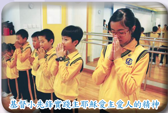
基督小先鋒實踐主耶穌愛主愛人的精神