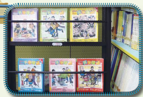
圖書館-主題圖書推介： 〈老夫子 笑學成語〉

透過上述不同的閱讀活動，學校期望能讓學生養成良好的閱讀習慣，鼓勵學生廣泛閱讀，從而達至自主學習。