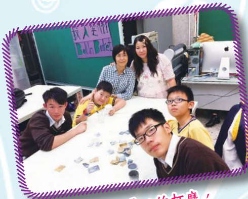
作品經過悉心的打磨，才有良好的效果