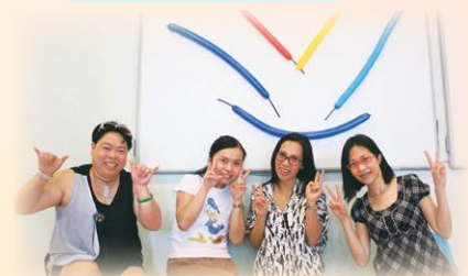
家長展現燦爛的笑容