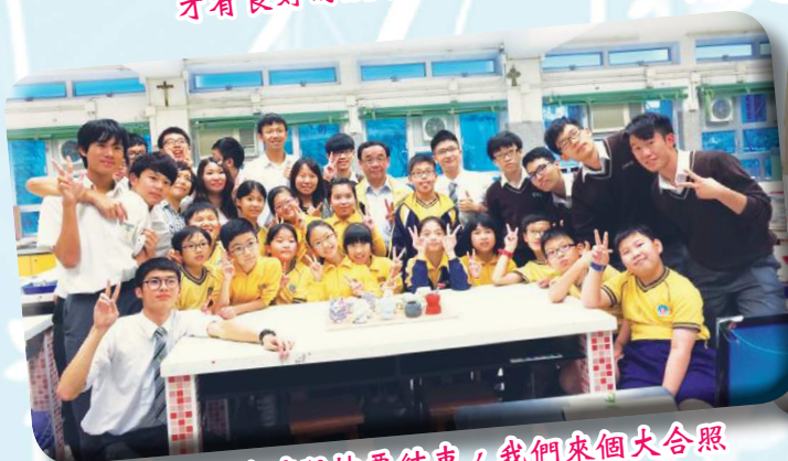
三次的合作時段快要結束，我們來個大合照