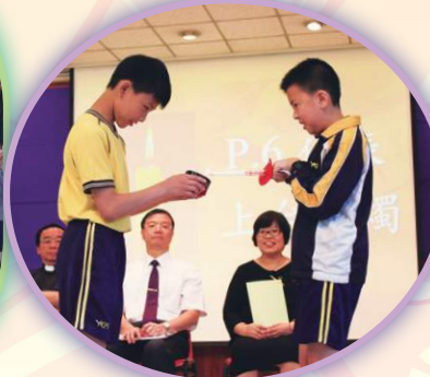
傳燈禮上點燃燭光，寓意把油天的優良傳統承傳下去。