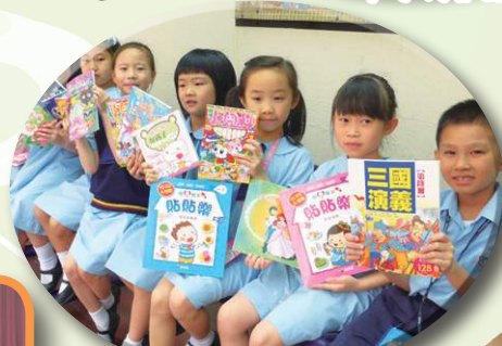
他們都選購了心儀的圖書