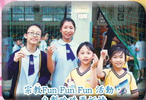
宗教Fun Fun Fun 活動 自製唸珠再祈禱