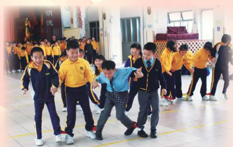
互相扶持，闖過難關。