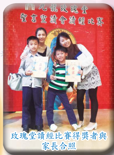
玫瑰堂讀經比賽得獎者與家長合照