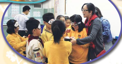
奧比斯矇眼午餐活動