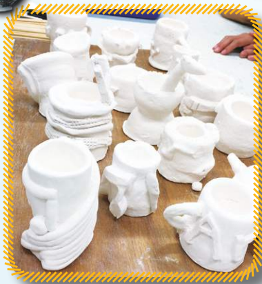
這是經過素燒後的作品