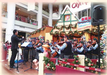
報佳音，同慶教主降臨。