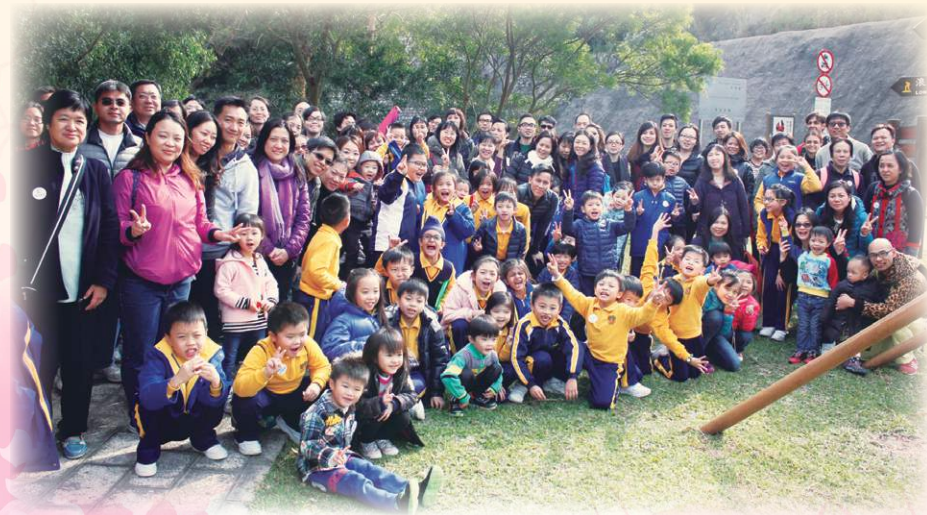
出發往萬宜西壩前的大合照