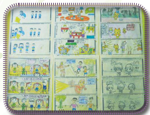
「四格漫畫」創作比賽：評評看！ 同學的作品也不錯吧！