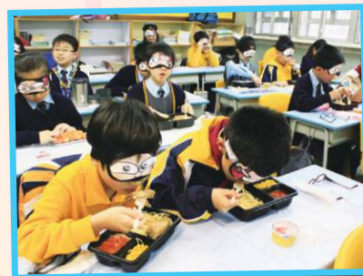
參加奧比斯「矇眼午餐」，學會珍惜所有。