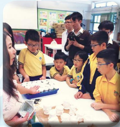
老師講解給作品上釉時要注意的事項