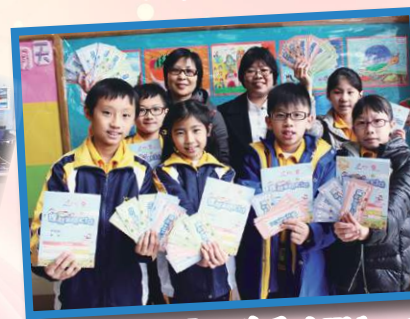
我們都是「理財至叻Kid」。