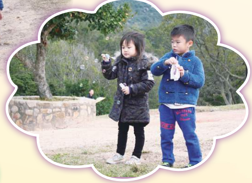
郊野公園內吹泡泡樂趣多