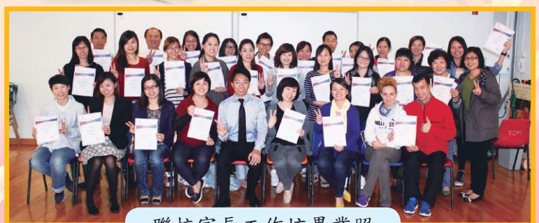
聯校家長工作坊畢業照