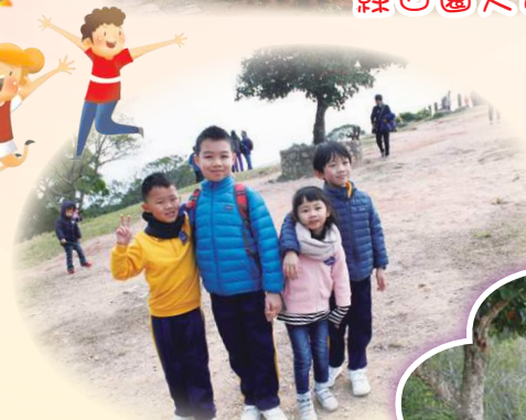
大坳門山上拍照留念