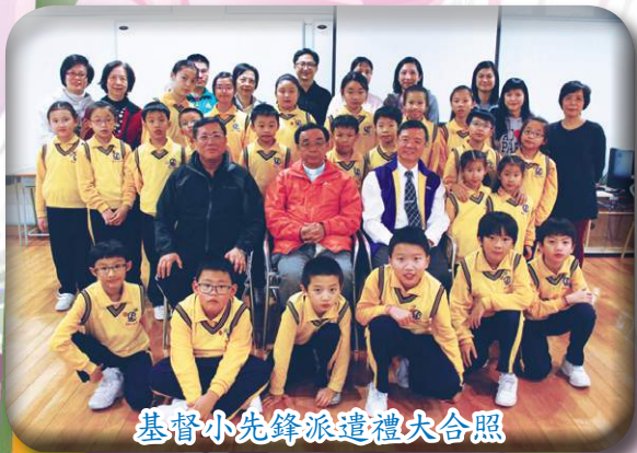
基督小先鋒派遣禮大合照