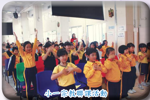
小一宗教聯課活動