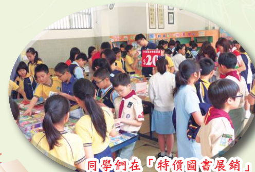
同學們在「特價圖書展銷」 中尋找喜愛的圖書