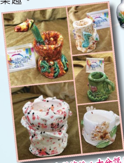
製成品的色彩繽紛，十分悅目