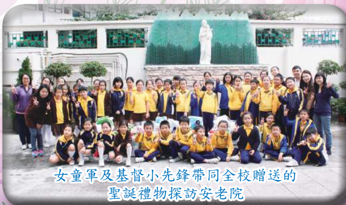
女童軍及基督小先鋒帶同全校贈送的 聖誕禮物探訪安老院