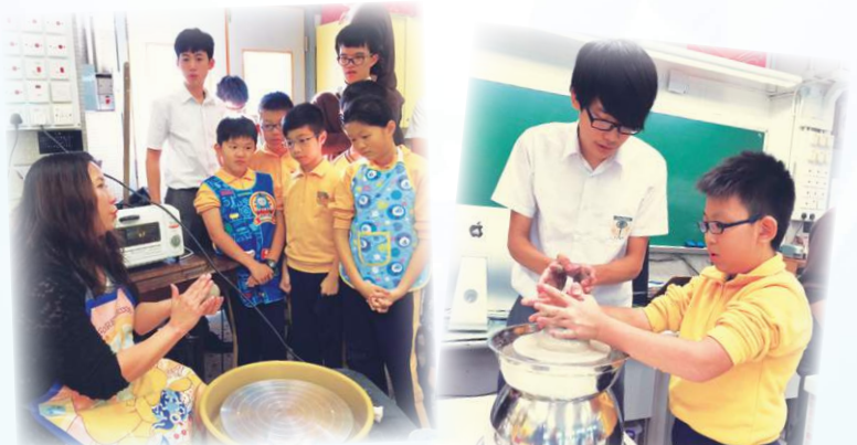
同學們聚精會神地學習

為了培養學生對美術的興趣，讓學生接觸不同的素材，本校於2014年11月與長沙灣天主教英文中學視藝組合作，為學生舉辦了三天的陶藝創作活動課程，讓學生體會陶藝製作的過程，發揮創意，享受藝術創作的樂趣。