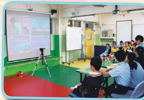
同學於「網上埠際英語辯論比賽」上雄辯滔滔。