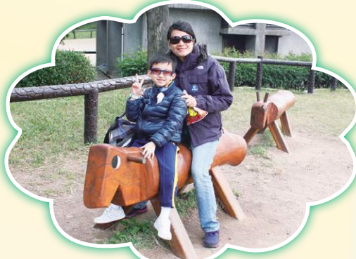
清水灣郊野公園親子樂