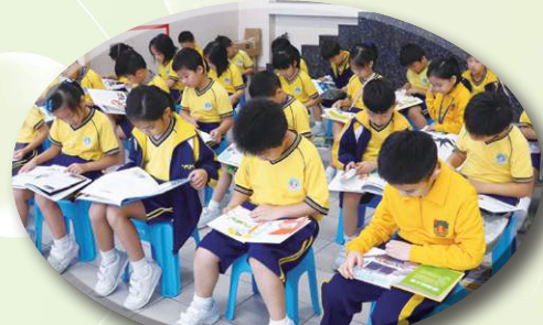
生活百科圖書展：一人一書， 安座凳上靜心閱讀。