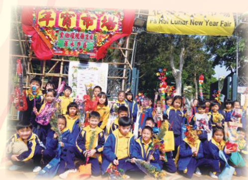
開開心心逛年宵市場。