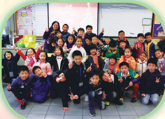
聖誕聯歡會上笑聲不斷。