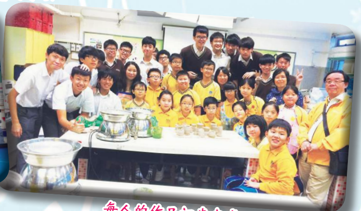
每人的作品初步完成