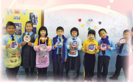
看我們的作品多漂亮。