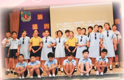
畢業生在惜別會上跟老師依依話別。