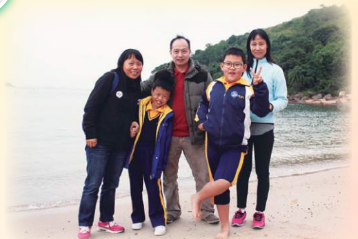
到了海下灣海岸公園真興奮