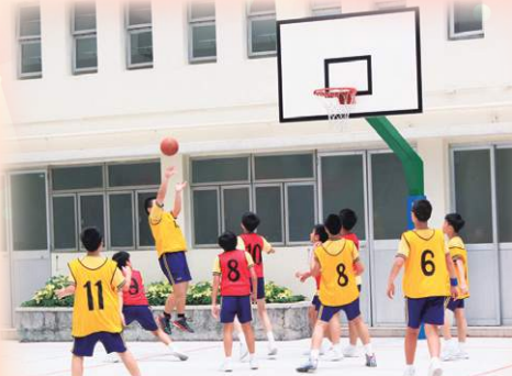
六年級班際籃球比賽，賽情激烈。