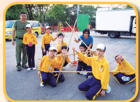
同心合力，完成任務。