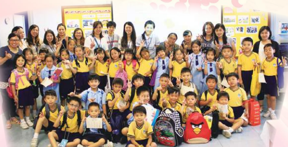
我們會用普通話進行購物活動。