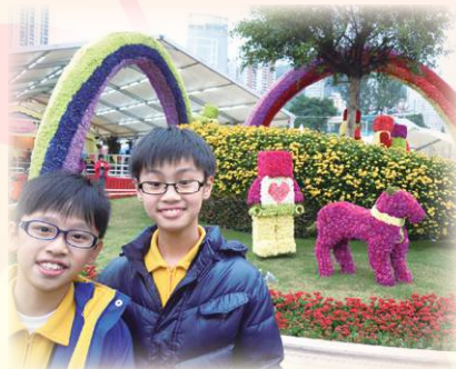
參觀花卉展，大開眼界。