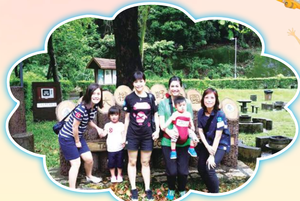
老師也同享親子樂