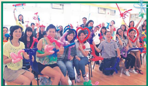
家長的作品各有特色