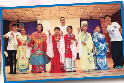
穿上粵劇戲服學做手。