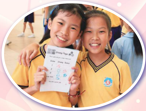
English Fun Day 樂趣多。