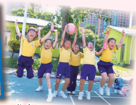
秋季旅行，身心舒暢。