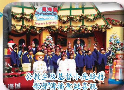
公教生及基督小先鋒藉 歌聲傳播聖誕喜訊