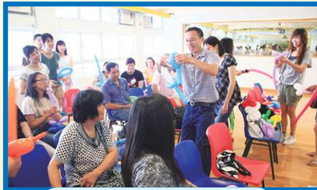
大家齊來學扭汽球