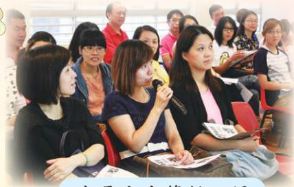
家長分享管教心得