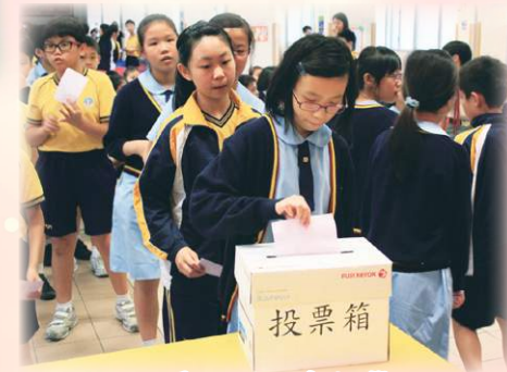
一人一票，選出卓越學生。