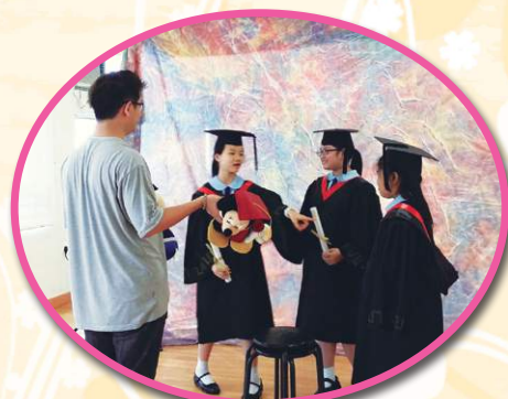
為六年級同學舉辦穿學士袍拍照活動