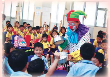
小一歡樂校園紛紛Fun。