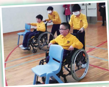
「輪椅競技」讓我們領略到要多關懷殘疾人士。