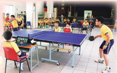
大家聚精會神，看誰最後能在班際乒乓球比賽中勝出。