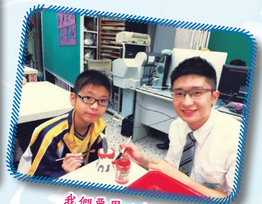
我們要用心上釉呢