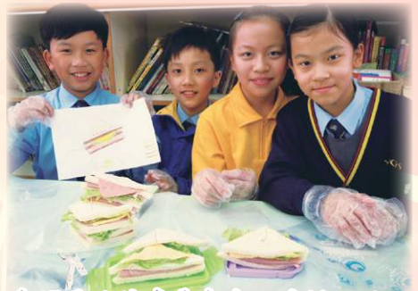
我們弄的健康美食令人垂涎三尺。