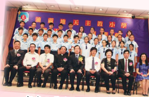
祝各位畢業生前程錦繡。