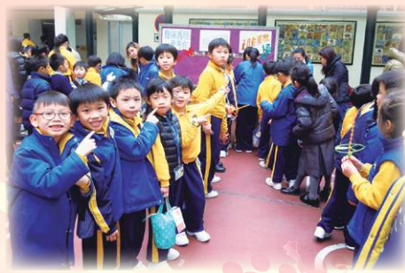
同學踴躍參加「口齒伶俐嘉年華」。