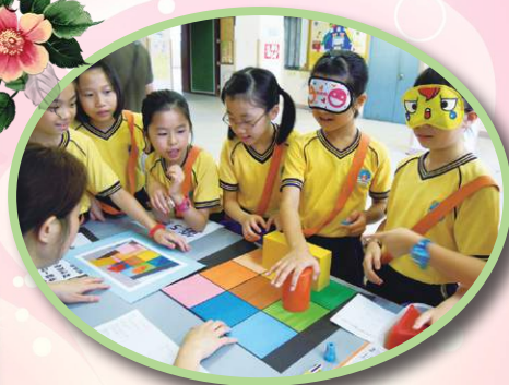
「數學遊蹤」，齊動腦筋。