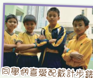
同學們喜愛配戴計步錶

本校安排星期二及星期四早上進行「晨跑」訓練活動，參與「晨跑」的同學可配戴一隻計步錶。計步錶除了顯示溫度、時間外，更可顯示跑步者的步數。同學們除了跑步外，更可以與同學比拼一下所跑的步數和距離。計步錶無形中增添了跑步的樂趣，更提升他們對跑步的動機，難怪同學們對計步錶愛不惜手!