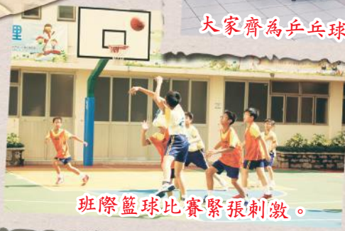
班際籃球比賽緊張刺激。