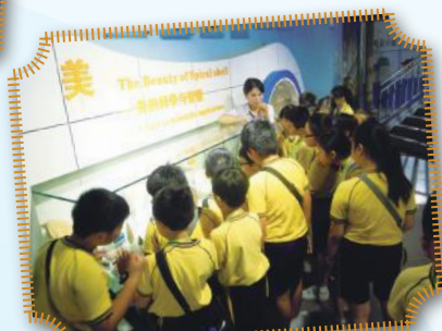
學生於惠州科技館專心學習