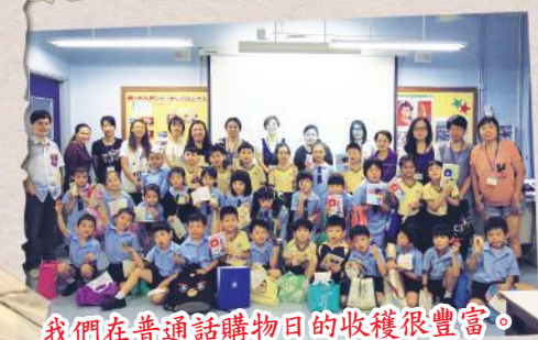
我們在普通話購物日的收穫很豐富。