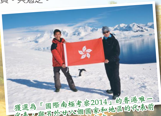
獲選為「國際南極考察2014」的香港唯一代表，與另外廿六個國家和地區的代表前往南極進行考察。