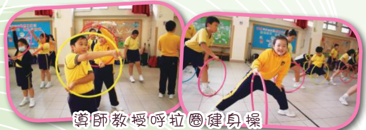
導師教授呼拉圈健身操

為此，本校舉辦一項體重管理計劃，聘請「中國香港體適能總會有限公司」提供相關專業協作，指導有需要的同學進行適當的健體運動。專業導師利用不同種類的健體運動，例如：橡筋帶健身操、呼拉圈健身操、毛巾健身操、KickBoxing等，藉此提升參加者對運動的興趣及習慣。