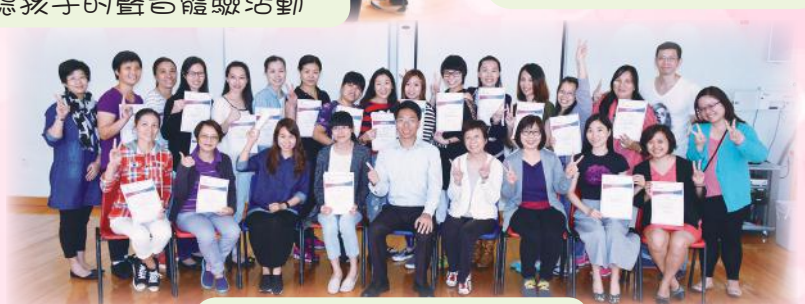
聯校家長工作坊畢業照