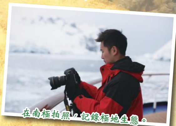
在南極拍照，記錄極地生態。