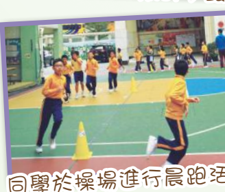
同學於操場進行晨跑活動