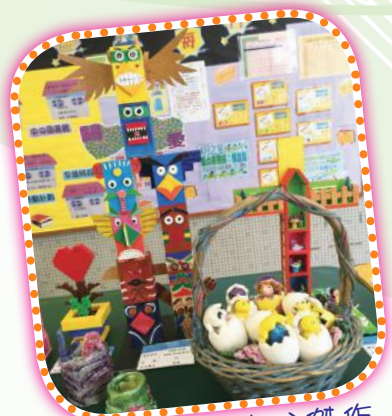
同學們的精心傑作

為促進同學對視覺藝術的興趣，拓闊大家的視野，本校聯同聖方濟愛德小學、油蔴地天主教小學（海泓道）合辦了聯校視藝作品展。是次活動，三間學校合共展出逾一百三十五件作品，在2015年4月至5月間，舉行了巡迴展覽。作品均以生命、家庭、愛德作為創作主題。同學們利用不同的媒介及物料創作，每件作品都流露出孩子們的真情實感，讓大眾看見兒童世界的真、善、美。為鼓勵及表揚同學們的出色表現，大會更設有多個獎項，邀請到資深藝術教育工作者施漪漣女士作專業評審，並在6月30日頒發獎項，與同學分享創作心得，各校的老師、同學和家長都得以交流，確實獲益良多。