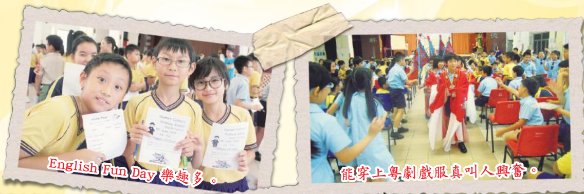
English Fun Day 樂趣多。