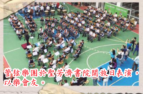
管弦樂團於聖芳濟書院開放日表演，以樂會友。