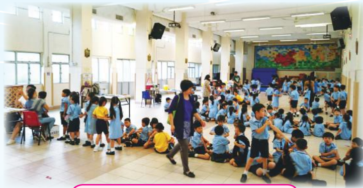
協助一年級同學注射防疫針