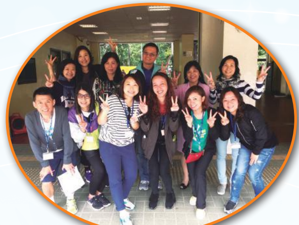
一起參與陸運會比賽