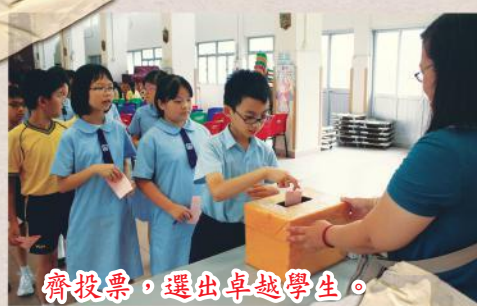
齊投票，選出卓越學生。