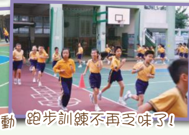
跑步訓練不再乏味了!