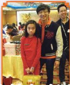
新春行大運大抽獎