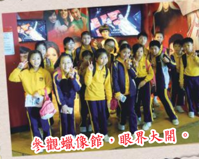
參觀蠟像館，眼界大開。