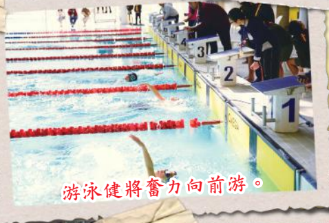
游泳健將奮力向前游。