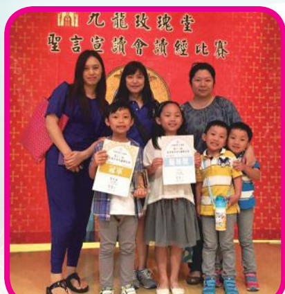
九龍玫瑰堂讀經比賽參賽學生與家長及老師合照