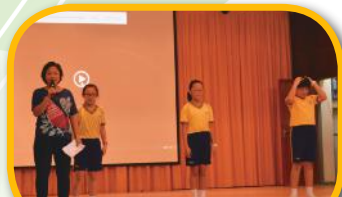
老師及同學介紹護脊操