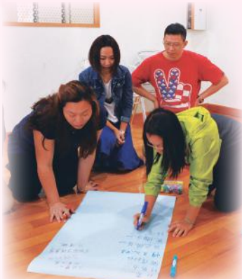
一起腦震盪列出讚賞孩子的內容