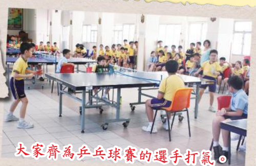
大家齊為乒乓球賽的選手打氣。