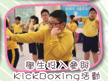
學生投入參與 KickBoxing活動