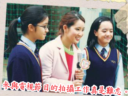
參與電視節目的拍攝工作真是難忘。