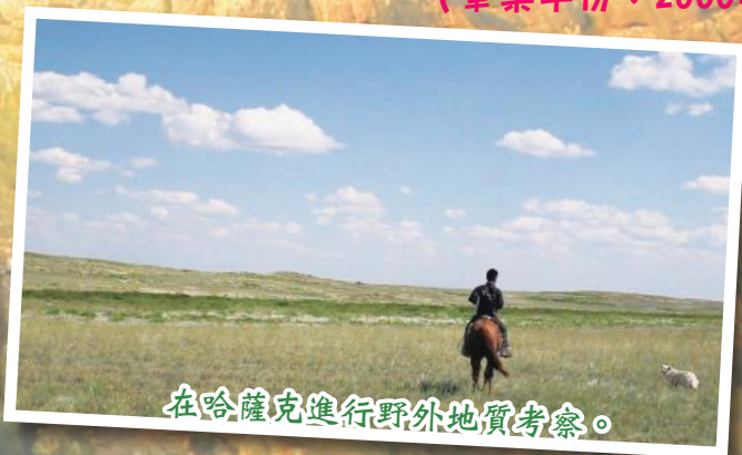
在哈薩克進行野外地質考察。