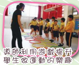
導師利用遊戲提升學生做運動的樂趣