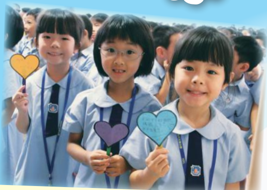
開學祈禱時學生手執寫上今年訂立的目標(愛德行為)的心形牌