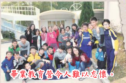
畢業教育營令人難以忘懷。