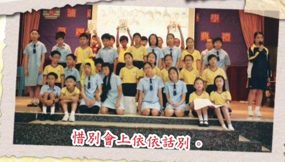
惜別會上依依話別。