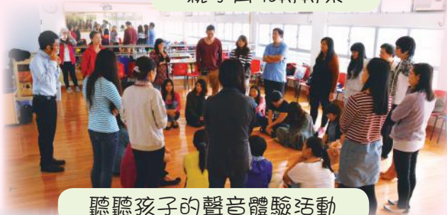
聽聽孩子的聲音體驗活動