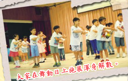
大家在舞動日上施展渾身解數。