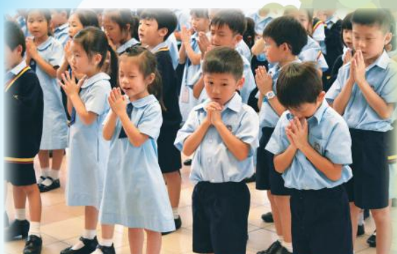
小一宗教聯課活動時小朋友誠心祈禱