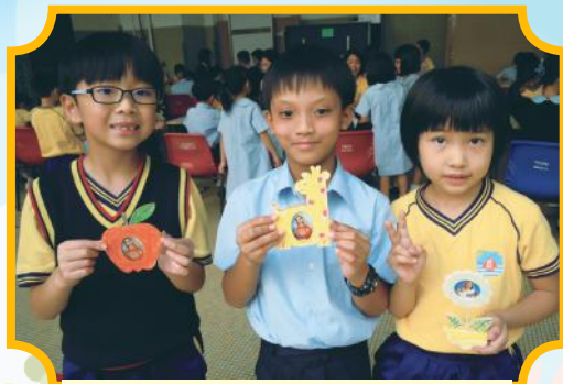
宗教FUN FUN FUN活動