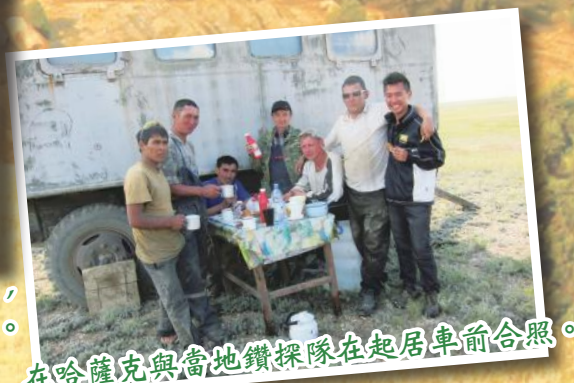
在哈薩克與當地鑽探隊在起居車前合照。