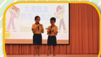
小司儀介紹護脊校園計劃