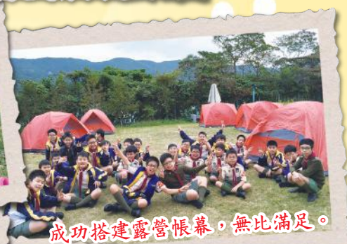
成功搭建露營帳幕，無比滿足。