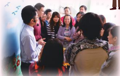
家長們用心聆聽導師的指示