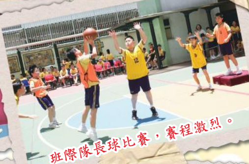
班際隊長球比賽，賽程激烈。