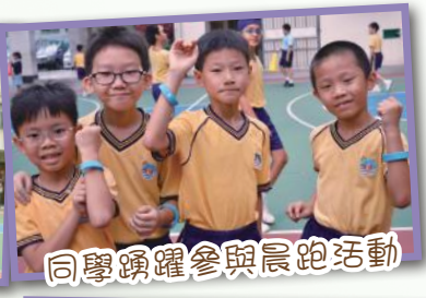
同學踴躍參與晨跑活動