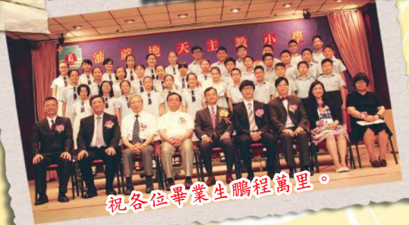
祝各位畢業生鵬程萬里。