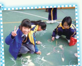
我很滿意自己的作品