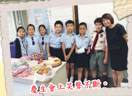
慶生會上笑聲不斷。