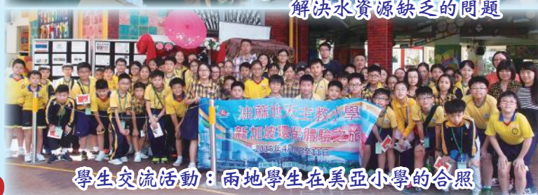
學生交流活動：兩地學生在美亞小學的合照