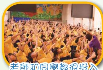
老師和同學都很投入