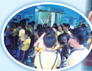
參觀惠東海龜國家級自然保護區