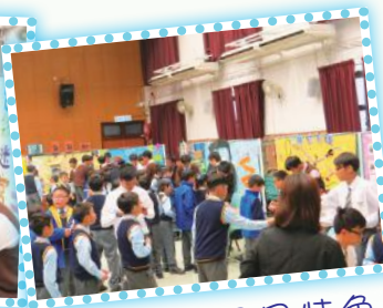
攤位遊戲各具特色