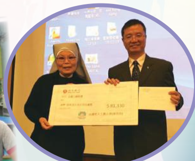
譚校長把善款轉交上水聖若瑟安老院