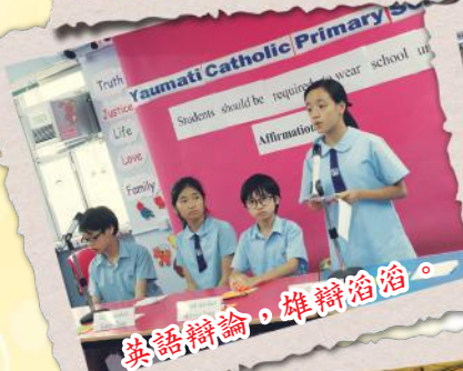
英語辯論，雄辯滔滔。