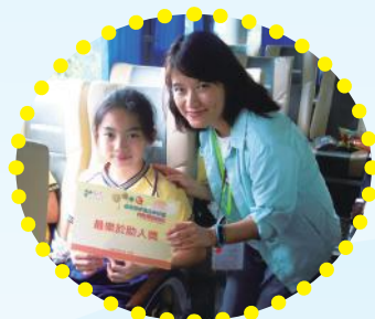
最樂於幫助別人的同學！ 值得稱讚！

是次交流活動令學生得益不少，不但能夠認識及體驗惠州的環保設施和自然保護區，更能夠學習到人與人之間的溝通和共處，旅程完結後，同學們亦十分回味這次珍貴難忘的交流。