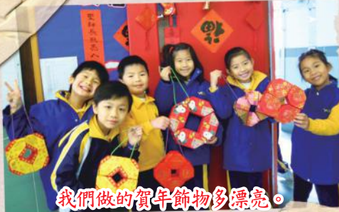
我們做的賀年飾物多漂亮。