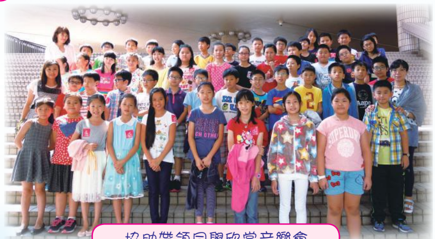
協助帶領同學欣賞音樂會