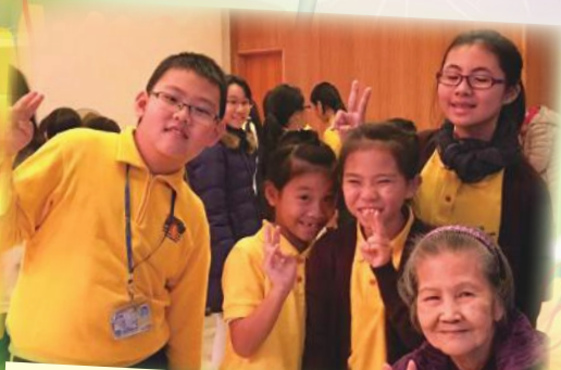
基督小先鋒及女童軍探訪安老院