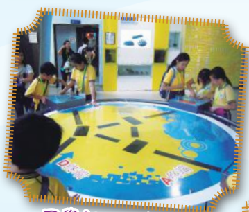
同學們正研究新奇 有趣的科技