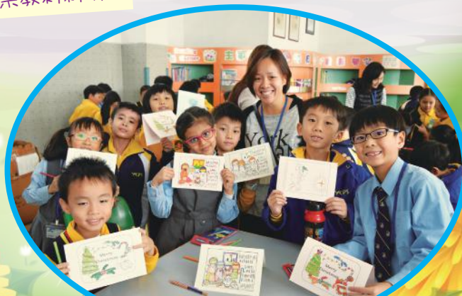
學生製作聖誕咭送贈老人家