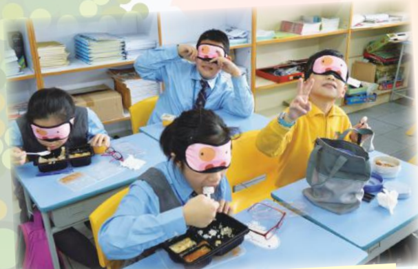
小四學生參與奧比斯蒙眼午餐體驗失明人士的困難及作出協助