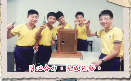
同心合力，完成任務。