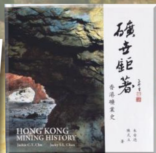
筆者著作《礦世鉅著》，紀錄了香港的礦業歷史。